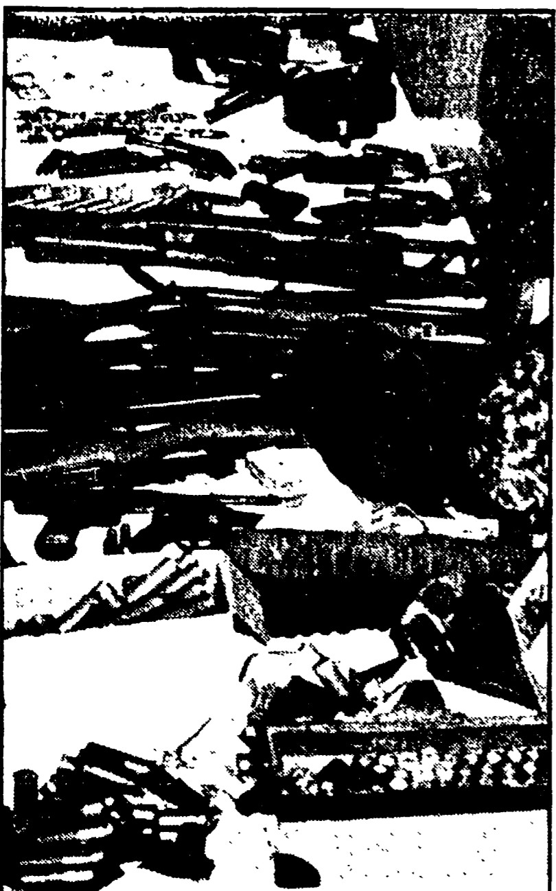
PALERMO - Le armi sequestrate nel covo dei banditi arrestati