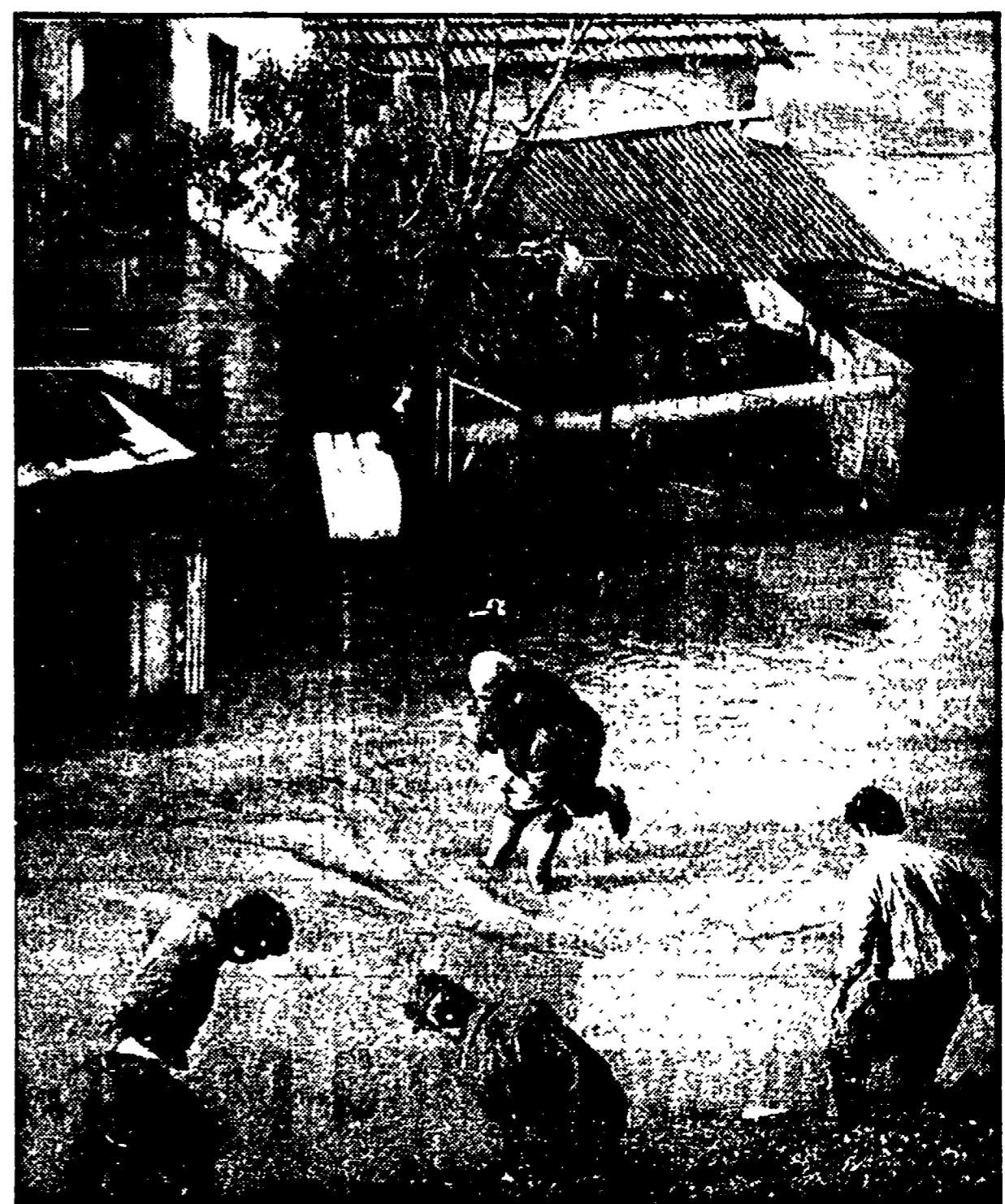
L'ondata di maltempo che ha colpito molte regioni italiane non accenna a diminuire. Mentre in montagna continua a nevicare, in pianura la pioggia che cade incessantemente...