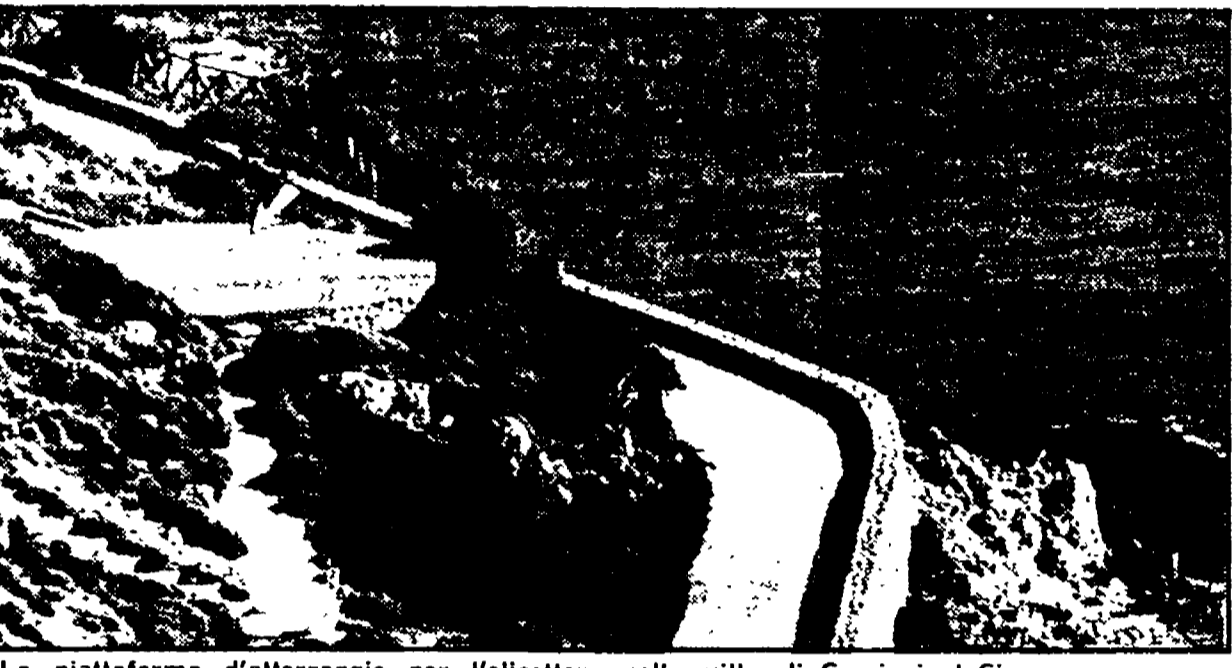
La piattaforma d'atterraggio per l'elicottero nella villa di Crociani al Circeo