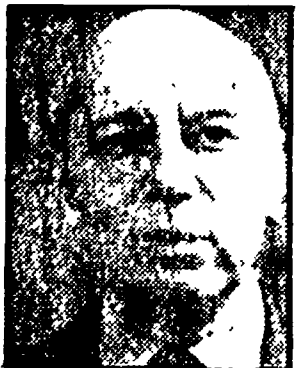
PAJETTA — E' in gioco l'indipendenza nazionale