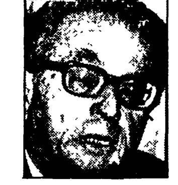
LA MALFA — Alla ricerca di una piattaforma comune