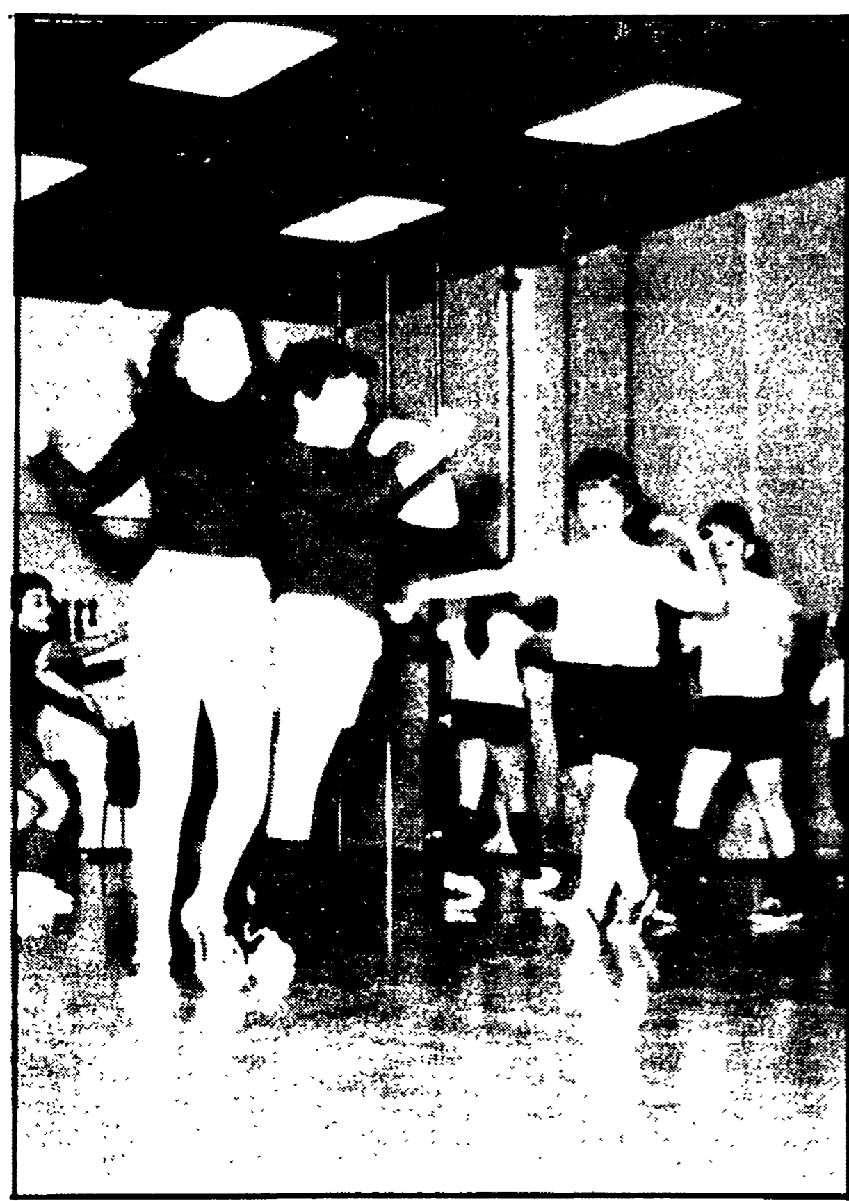
Alcuni bambini in un centro di formazione fisico sportiva dell'ARCI-UISP

Vive proteste contro l'accordo Provveditorato-CONI sui corsi extrascolastici di avviamento allo sport - Tentativo di svuotare il ruolo degli organi collegiali della scuola e dei CdQ - Ignorata la funzione degli enti locali