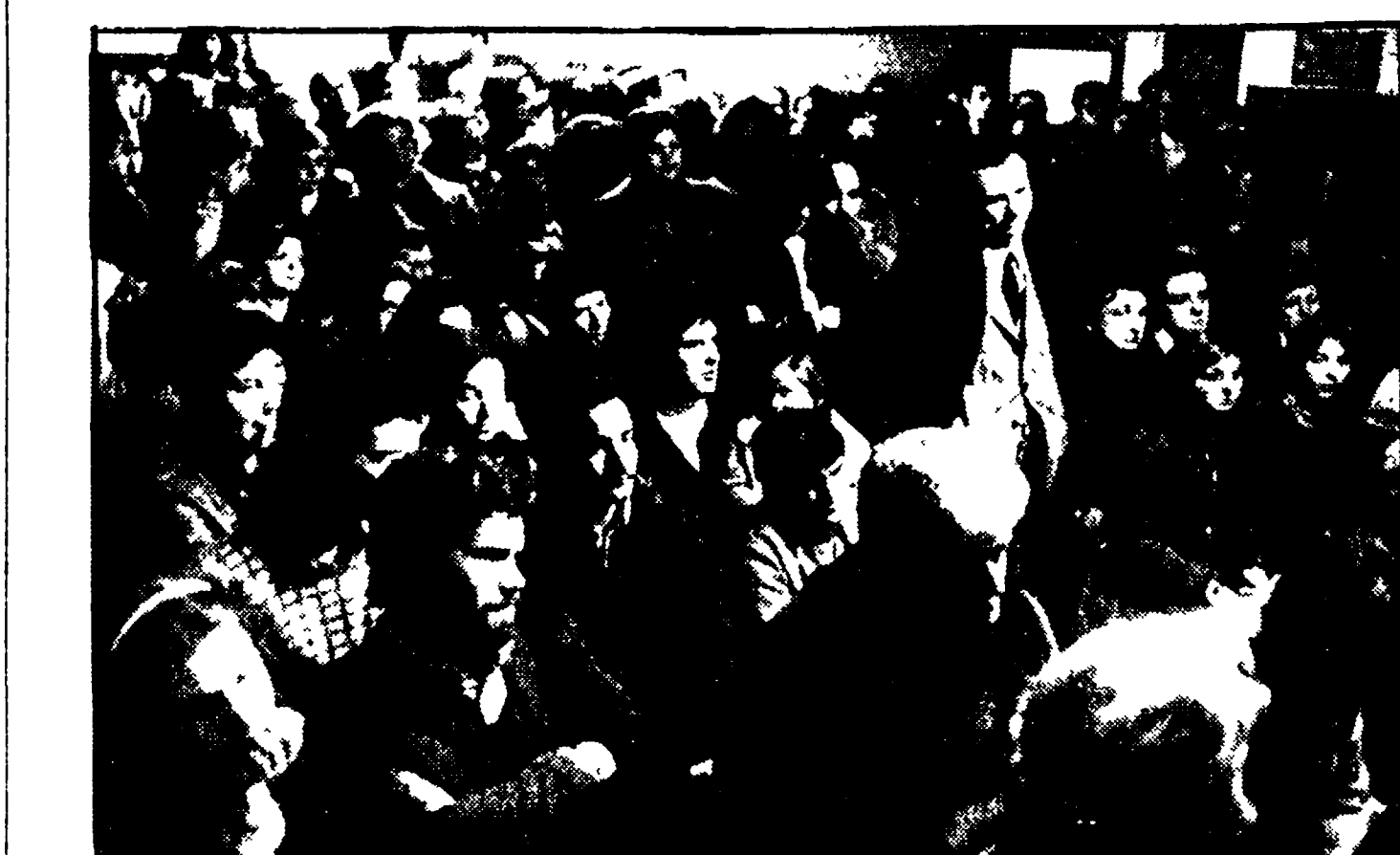
I compagni che ieri sera hanno preso parte all'inaugurazione della sezione comunista delle Valli