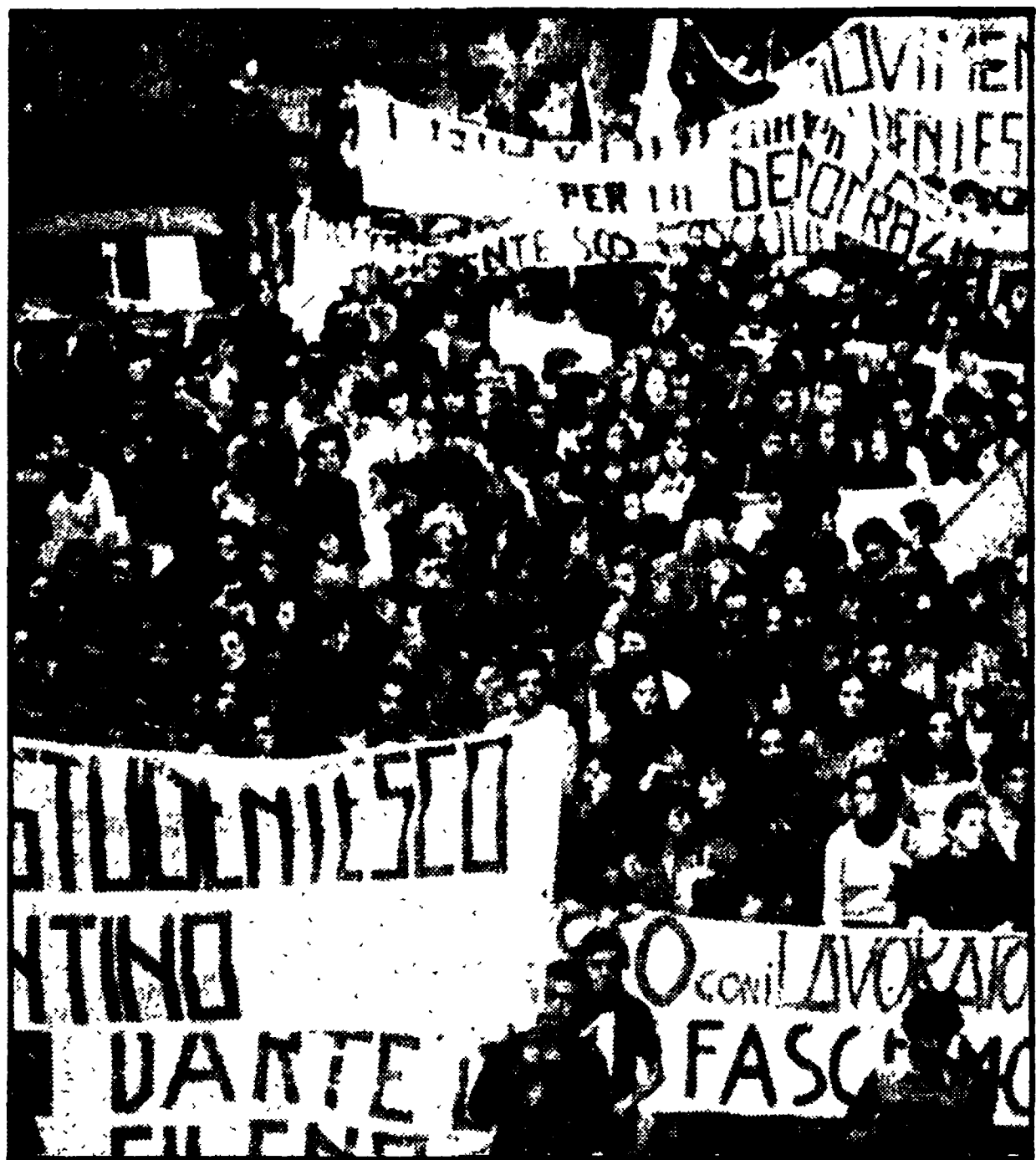
Una recente manifestazione per la libertà dei popoli oppressi dal fascismo

Scioperi e iniziative sono previste in tutta la regione. Pronta è stata la reazione e lo sdegno in provincia di Firenze. In questo contesto, la federazione provinciale CGIL-CISL-UIL, in concomitanza con lo sciopero generale indetto dai lavoratori spagnoli, ha deciso di sospendere l'attività in tutti i luoghi di lavoro dalle 10,30 alle 11 di tutti i giorni in occasione dell'assemblea, continuando a rafforzare l'azione di solidarietà concreta che si sta esprimendo anche nella sottoscrizione in atto nella provincia.