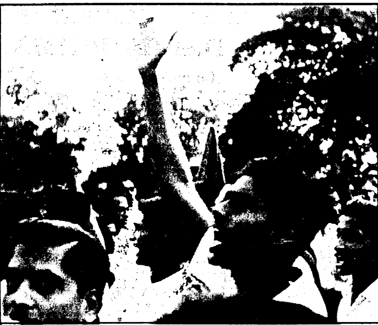
Una manifestazione popolare a Nuova Delhi