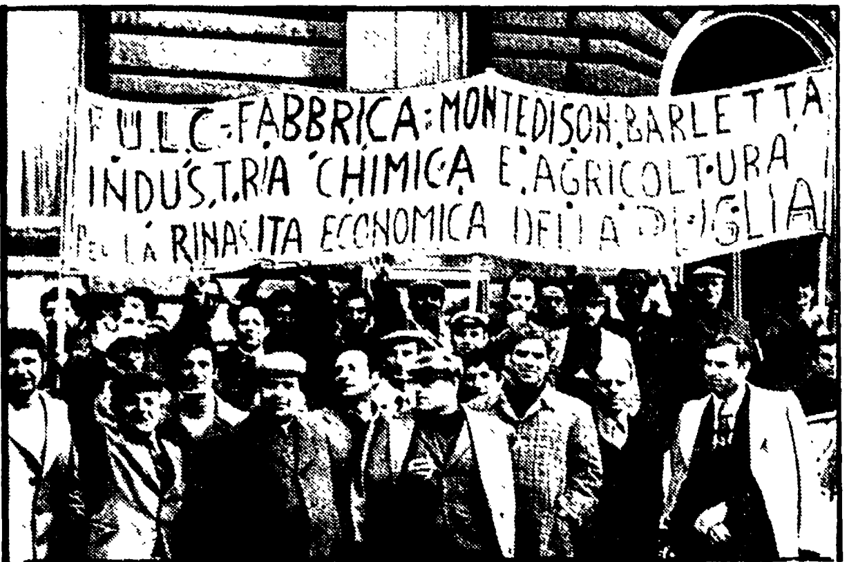
I lavoratori della Montedison di Barletta nel corso della protesta della settimana scorsa al ministero dell'Industria. I comunisti hanno ribadito, nel corso dei lavori della conferenza agraria, la necessità di una produzione collegata alle potenzialità di sviluppo dell'agricoltura

La lotta dei comunisti a fianco delle maestranze Montedison mobilitate contro la «liquidazione» dello stabilimento e per una produzione al servizio della potenzialità del Nord Barese