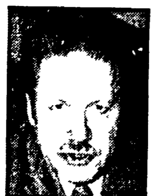
PICCOLI - Manovra sull'aborto