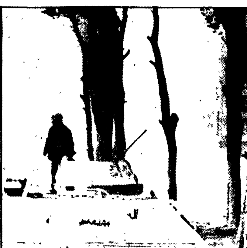
Reparti corazzati dell'esercito arabo libanese a poca distanza dal palazzo presidenziale di Beirut, che minacciano di attaccare da un momento all'altro