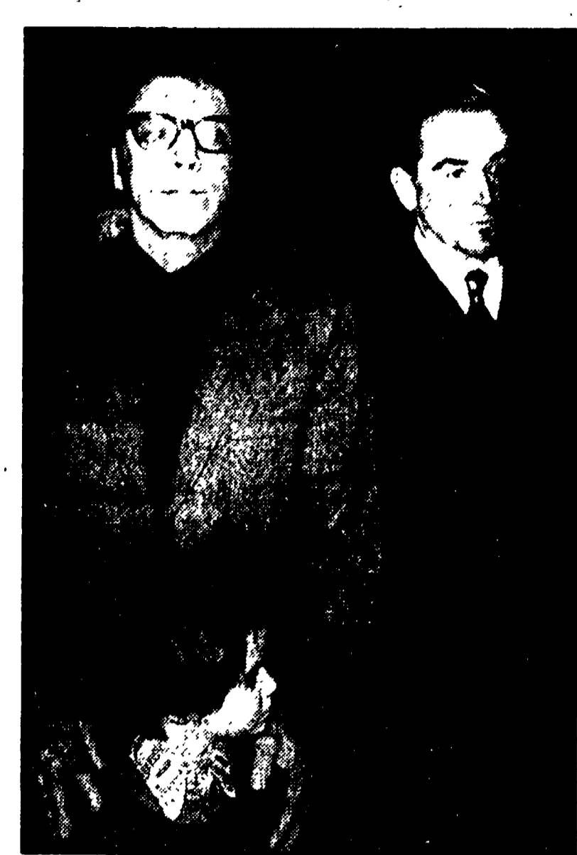
Due momenti del rito funebre. Nella foto a sinistra, Burl Lancaster con la figlioletta e Vittorio Gassman; nell'altra foto, scalfata all'ingresso della chiesa, sono visibili, a destra, i parenti di Visconti