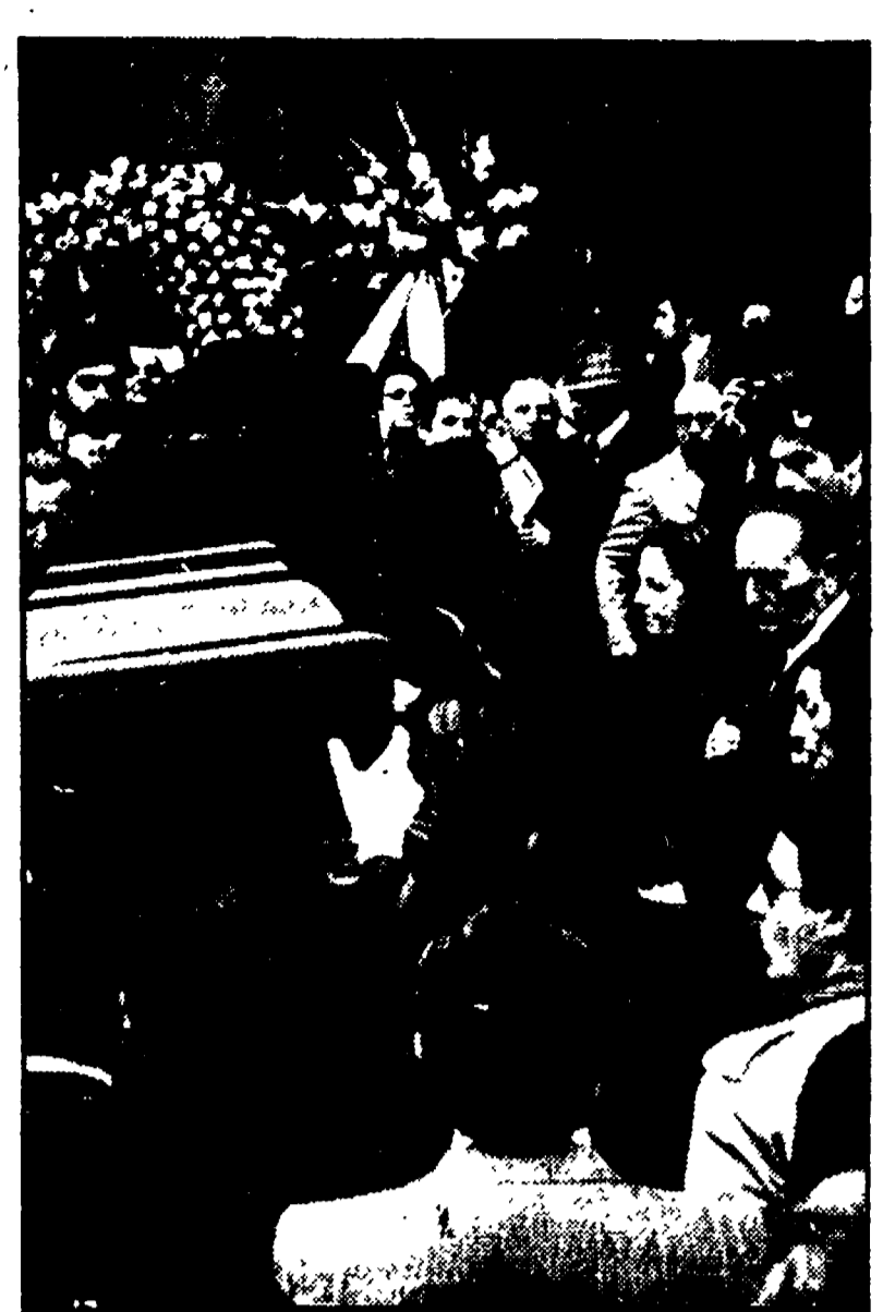
Due momenti del rito funebre. Nella foto a sinistra, Burl Lancaster con la figlioletta e Vittorio Gassman; nell'altra foto, scalfata all'ingresso della chiesa, sono visibili, a destra, i parenti di Visconti