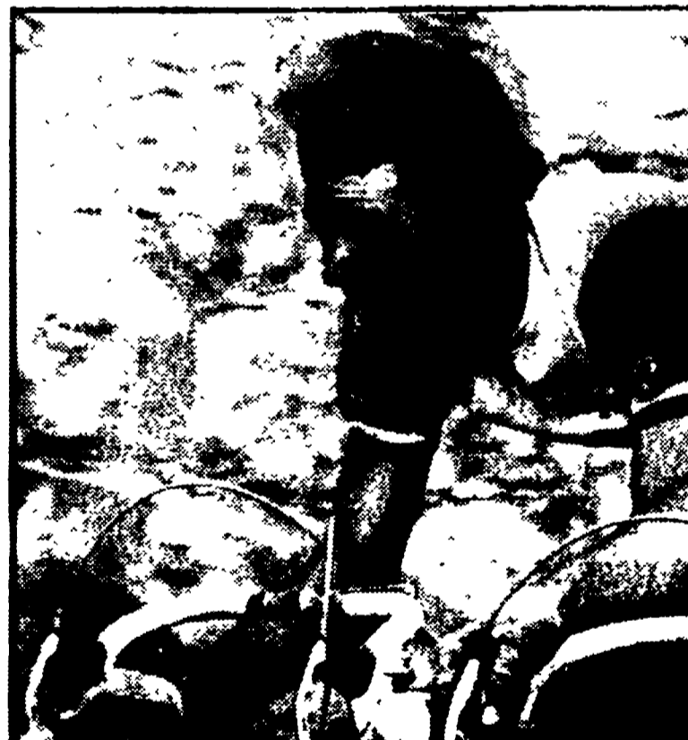
BARONCHELLI: ha fatto quel che ha potuto

SANREMO. 19. Realizzato il record prestigioso della settimana vittoria a Sanremo, Merckx manifesta la sua gioia con la semplicità di un bambino. Dieci anni dopo ancora lui sul podio come nel '66.