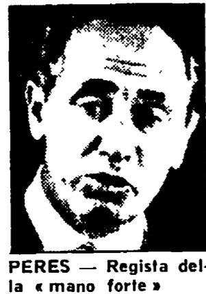
PERES - Regista della «mano forte»

Senonché i fatti, come si è detto, si sono mossi in direzione esattamente opposta. Già nel dicembre scorso, per