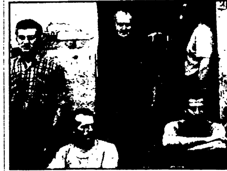
Un'immagine di «Un paese», il libro su Luzzara realizzato da Strand in collaborazione con Zavallini