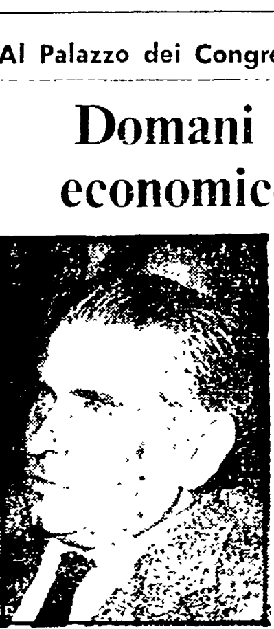
Al Palazzo dei Congressi

I contrastanti pareri sulla ristrutturazione di un palazzo - Sul banco degli accusati sette persone