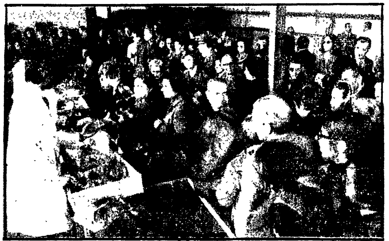
Un'immagine eloquente dell'affluenza del pubblico al mercato delle carni

Centinaia di persone sotto i capannoni di via Circondaria. Apprezzamenti per la qualità e la convenienza dei prezzi