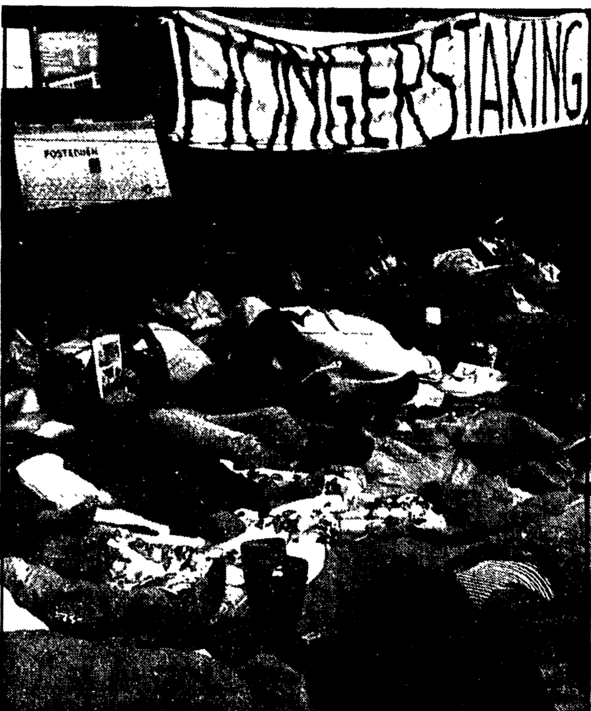
DIGIUNANO PER LE MOLUCCHE. Da tre giorni un gruppo di giovani originari delle Molucche meridionali fanno lo sciopero della fame davanti al mercato di Amsterdam per l'indipendenza delle loro isole contro (per usare le loro stesse parole) «l'oppressione dell'Indonesia e l'arroganza dell'Olanda». Nella foto: la protesta dei giovani molucchesi

Basta bere regolarmente Magrivel, una vera e propria dieta di erbe, gradevole e gustosa. Fidati di Magrivel: la buona tisana che depura e snellisce.