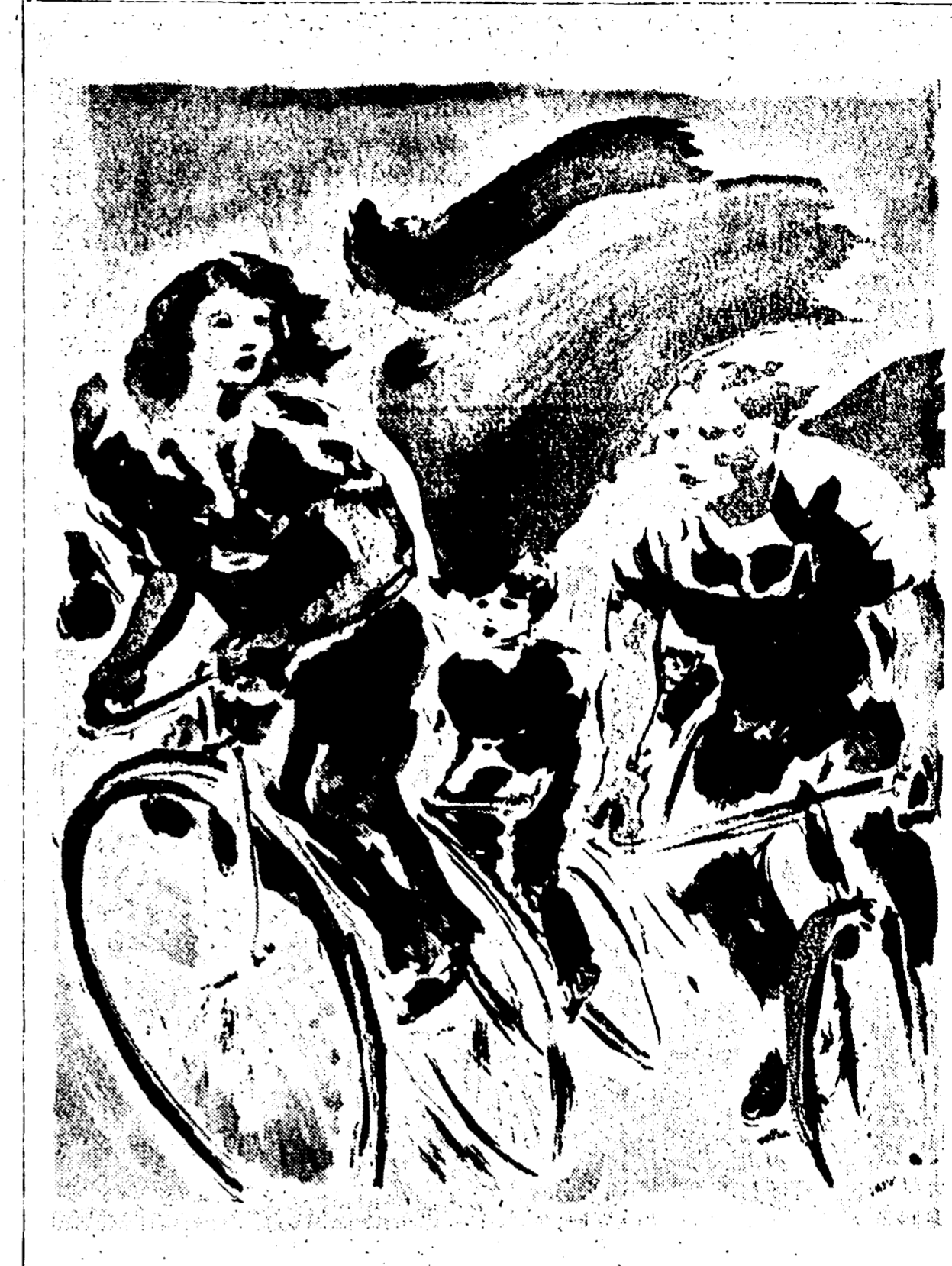
In occasione delle manifestazioni sportive che il nostro giornale organizza nel 31° anniversario della Liberazione...