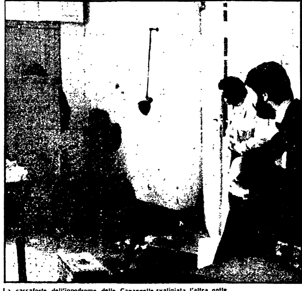
La cassaforte dell'ippodromo delle Capannelle svaligiata l'altra notte