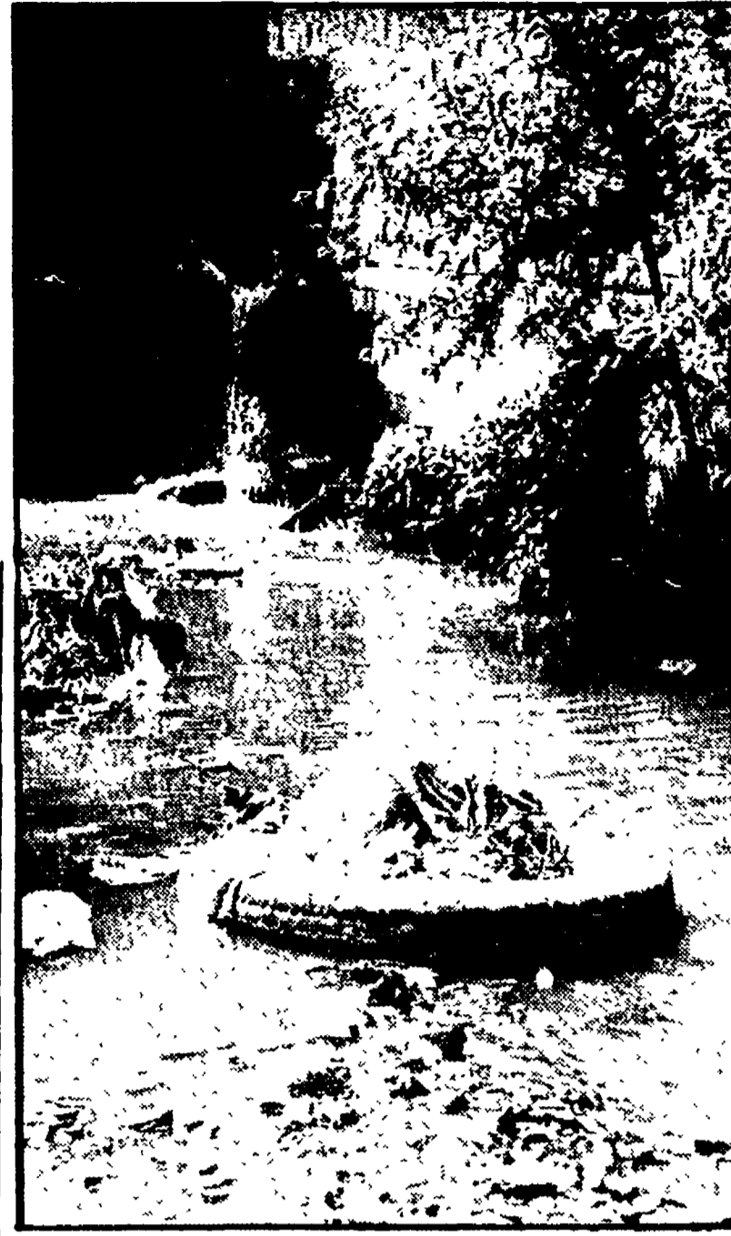
Rifiuti e scarichi fognanti lungo un tratto del torrente Vingone

Una soluzione, tutto sommato, che oltre ad essere estremamente funzionale si rivela anche economica, in corsi d'acqua più inquinati, come il Castro o il Vingone, che presenterebbe costi nettamente superiori, e non risolverebbe il problema della degradazione ambientale.