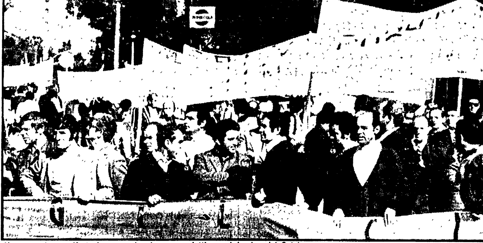
Una recente manifestazione per la ripresa produttiva nel bacino del Sulcis

Requisiti 20 forni per assicurare il pane all'Aquila. L'AQUILA, 30. Veniti forni della provincia de L'Aquila (quattro a Sulmona, quattro a L'Aquila, nove ad Avezzano e tre a Celano) sono stati requisiti con decreto del prefetto de L'Aquila per sbrancare l'illegitimamente ad oltranza alluata dai panificatori nell'intento di strappare un nuovo aumento del prezzo del pane.