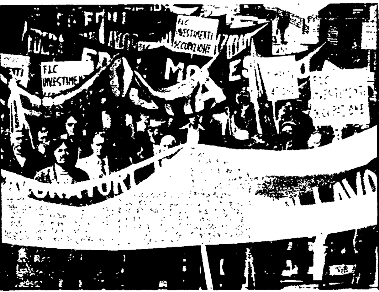
Il corteo dei lavoratori per le vie del centro contro i licenziamenti alla Sogene

Più forte la mobilitazione davanti alla nuova tenda eretta dopo l'attentato fascista - Presto nuovi incontri per risolvere la vertenza. Chiesta la cassa integrazione - Martedì assemblea aperta all'Immobiliare con le forze politiche democratiche e i sindacati di categoria