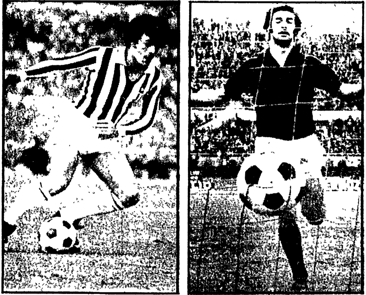
GORI e PULICI saranno chiamati a confronto indiretto domani

VRONA (22) - TORINO (43) — Per i granata di Radice lo scudetto sembra molto vicino, ma perché divenga realtà non potranno permettersi distrazioni domani a Verona, dove gli scudettati attendono certamente non rassegnati. Saranno di fronte l'attacco più forte (quello del Torino) e la difesa più debole (ovviamente quella del Verona) di questo campionato. Alla ricerca di un pareggio i veronesi impasteranno la loro partita sul contropiede, se dovesse fruttare loro almeno un punto sarà un successo che gli consentirà di vincere, mentre di contro per il Torino decisivo sarebbe poi l'incontro col Cesena.