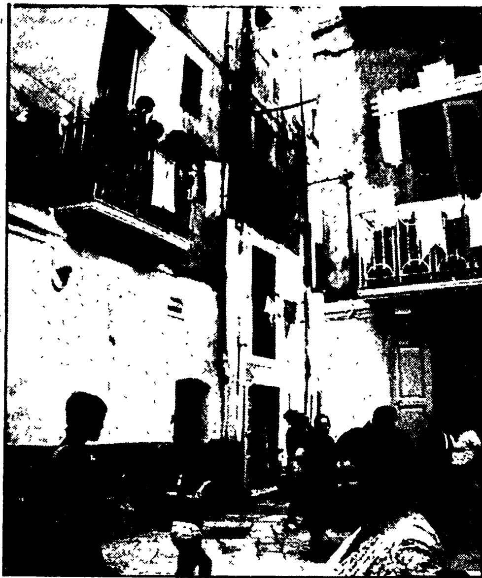
Bari, la città vecchia

Preoccupazioni per il tessuto produttivo e per l'occupazione - La Giunta si è dimostrata incapace di far fronte alle questioni sul tappeto La formula del centrosinistra non ha più un significato politico reale La necessità di una svolta profonda