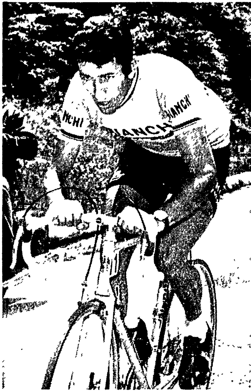
Felice Gimondi è giunto all'appuntamento col Giro in sordina, e forse volutamente, cioè accantonando energie per essere nuovamente protagonista.