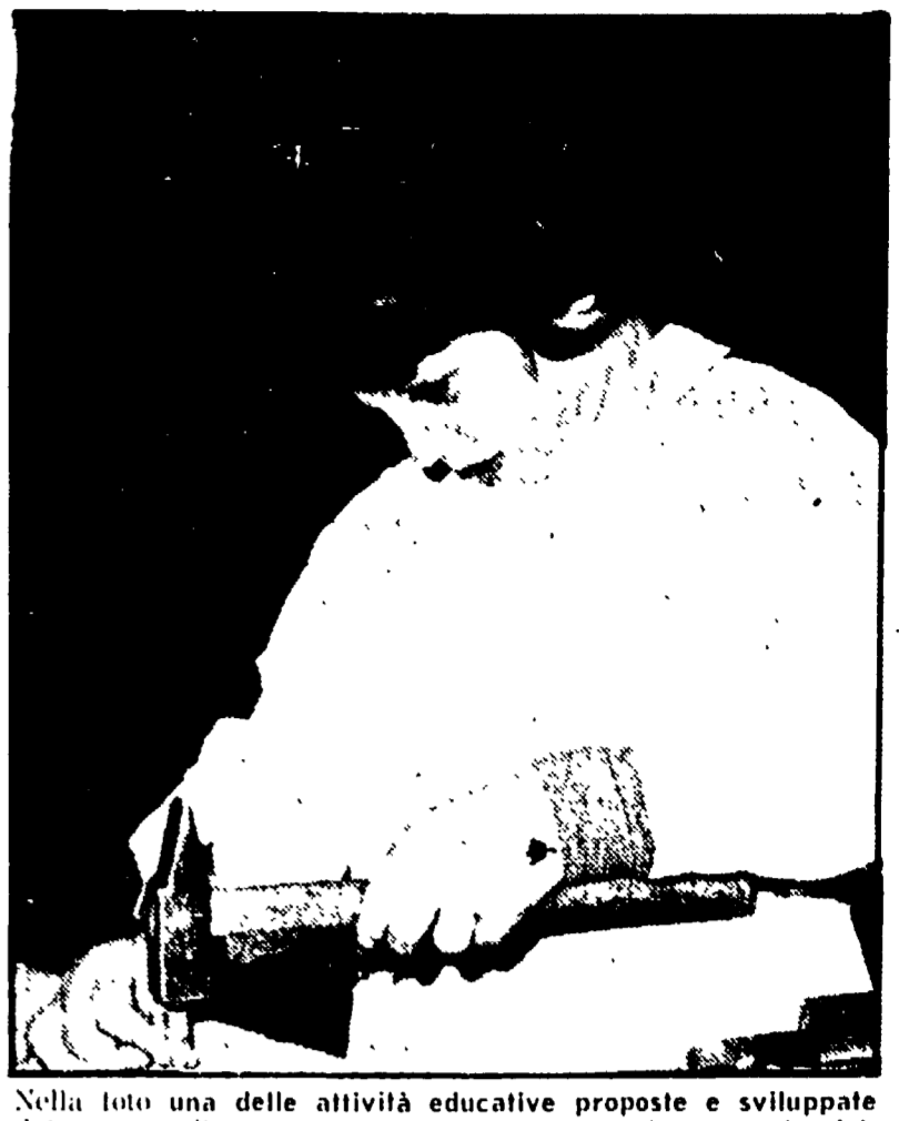
Nella foto una delle attività educative proposte e sviluppate dal gruppo di operatori e dalle educatrici della scuola dell'infanzia del Comune di Fano.

Come rispondere alle esigenze psico-fisiche del bambino - I legami profondi con la realtà quotidiana