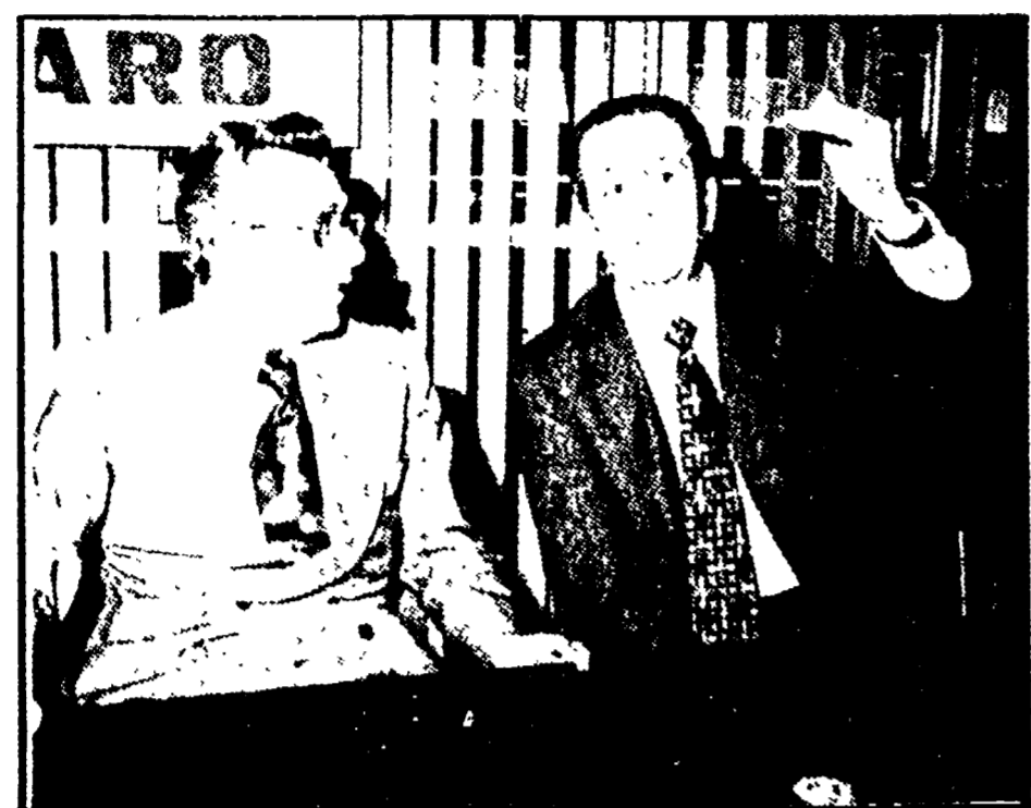
Flavio Orlandi e Arnaldo Forlani capolista del PSI e della DC

Per la formazione delle liste da presentare nella circoscrizione marchigiana, si può dire che nella DC si è giocato allo « staccio ». Le indicazioni delle commissioni provinciali sono state modificate ed a volte rovesciate dalla commissione regionale, mentre la scelta di quest'ultima sono state largamente smantellate dalla direzione nazionale del partito.