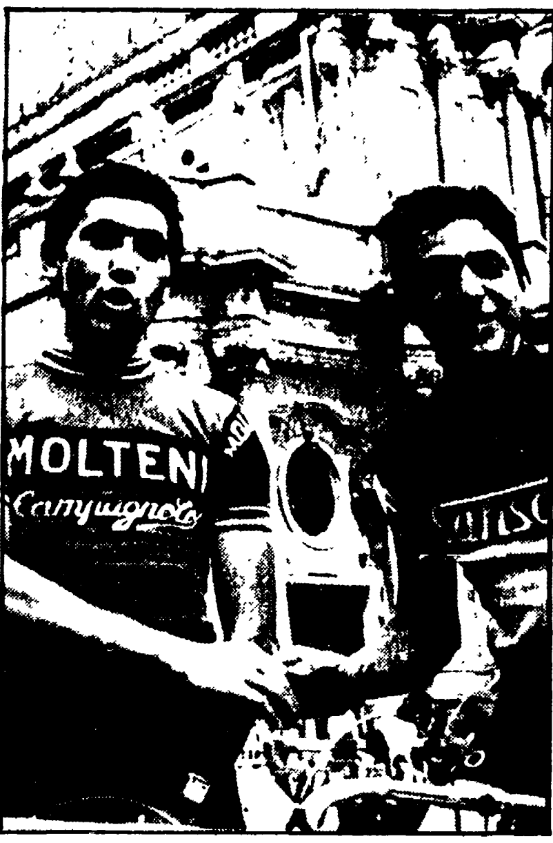
● EDDY MERCKX e FRANCESCO MOSER si stringono la mano prima dell'inizio delle ostilità

La «verve» di Moser e Baronchelli o l'esperienza di Merckx? - Il belga aspira alla sesta vittoria che gli consentirebbe il «record dei record» davanti a Coppi e Binda - Per «Gibi» è il momento della verità - Le possibilità di Battaglin e Bertoglio - Oggi prenderà il «via» il giro di Catania e la Catania-Siracusa