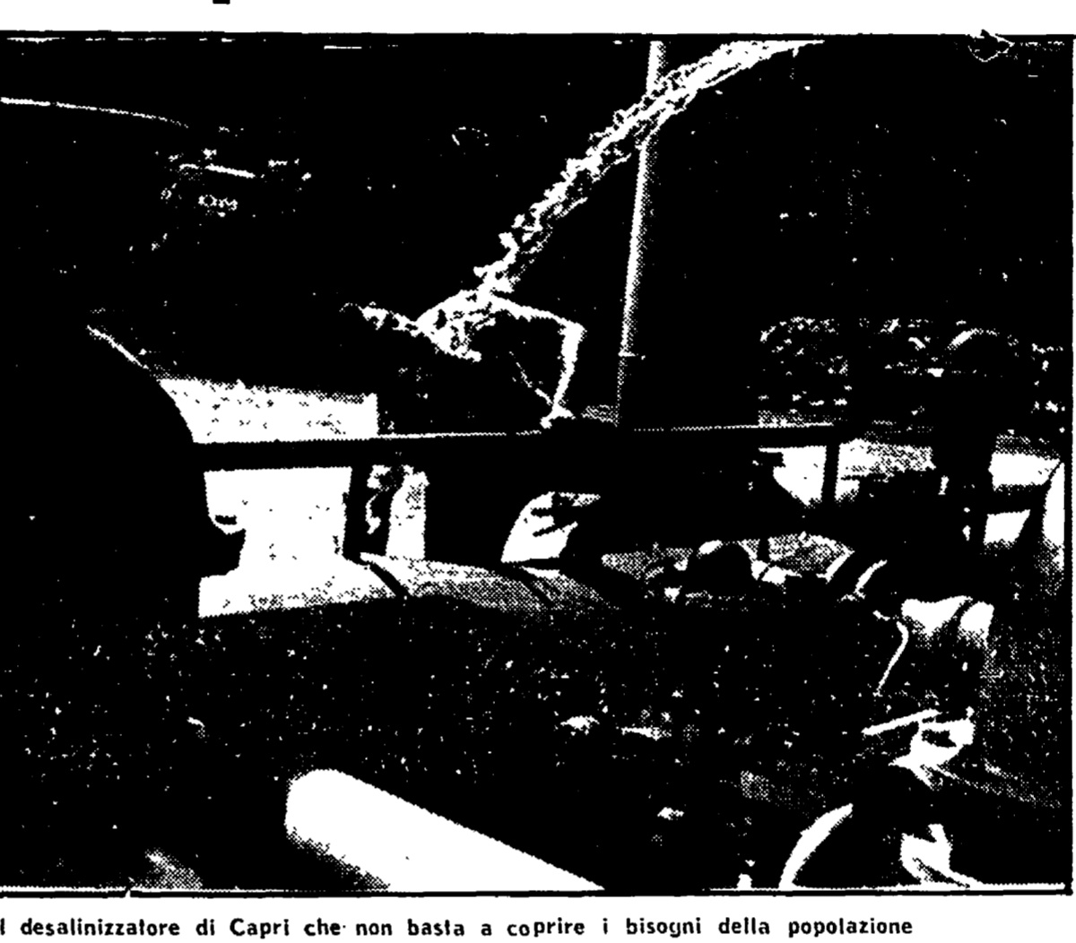
Il desalinizzatore di Capri che non basta a coprire i bisogni della popolazione

Raggiunto l'accordo ed entrato in funzione il dissalatore della Sippic, i comuni di Capri ed Anacapri insistono, giustamente, perché venga subito realizzato anche l'acquedotto da tempo progettato dalla Cassa per il Mezzogiorno. L'acqua del desalatore non basta al fabbisogno dell'isola la cui popolazione di 14 mila residenti aumenta fino a 36 mila persone durante la stagione estiva.