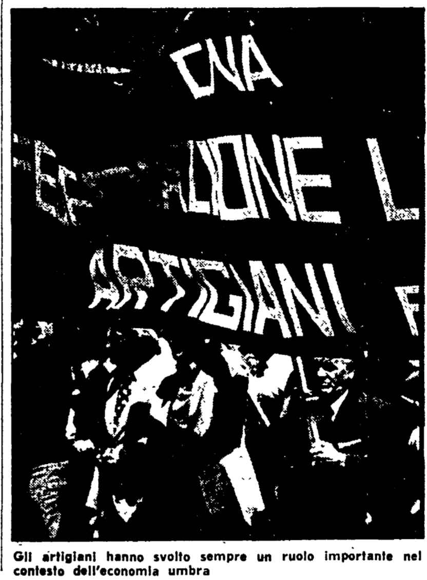
Gli artigiani hanno svolto sempre un ruolo importante nel contesto dell'economia umbra

Un documento della Confederazione degli artigiani - «La campagna elettorale segnerà un momento decisivo nella battaglia per una nuova politica economica e un nuovo ordine democratico»