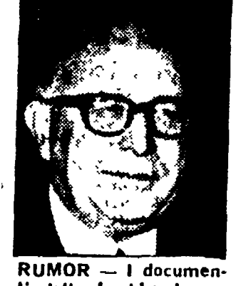
RUMOR - I documenti della Lockheed

«coerenza» esplicite non meglio specificate ma in ogni caso avvertite prima di tutto per molti dc.