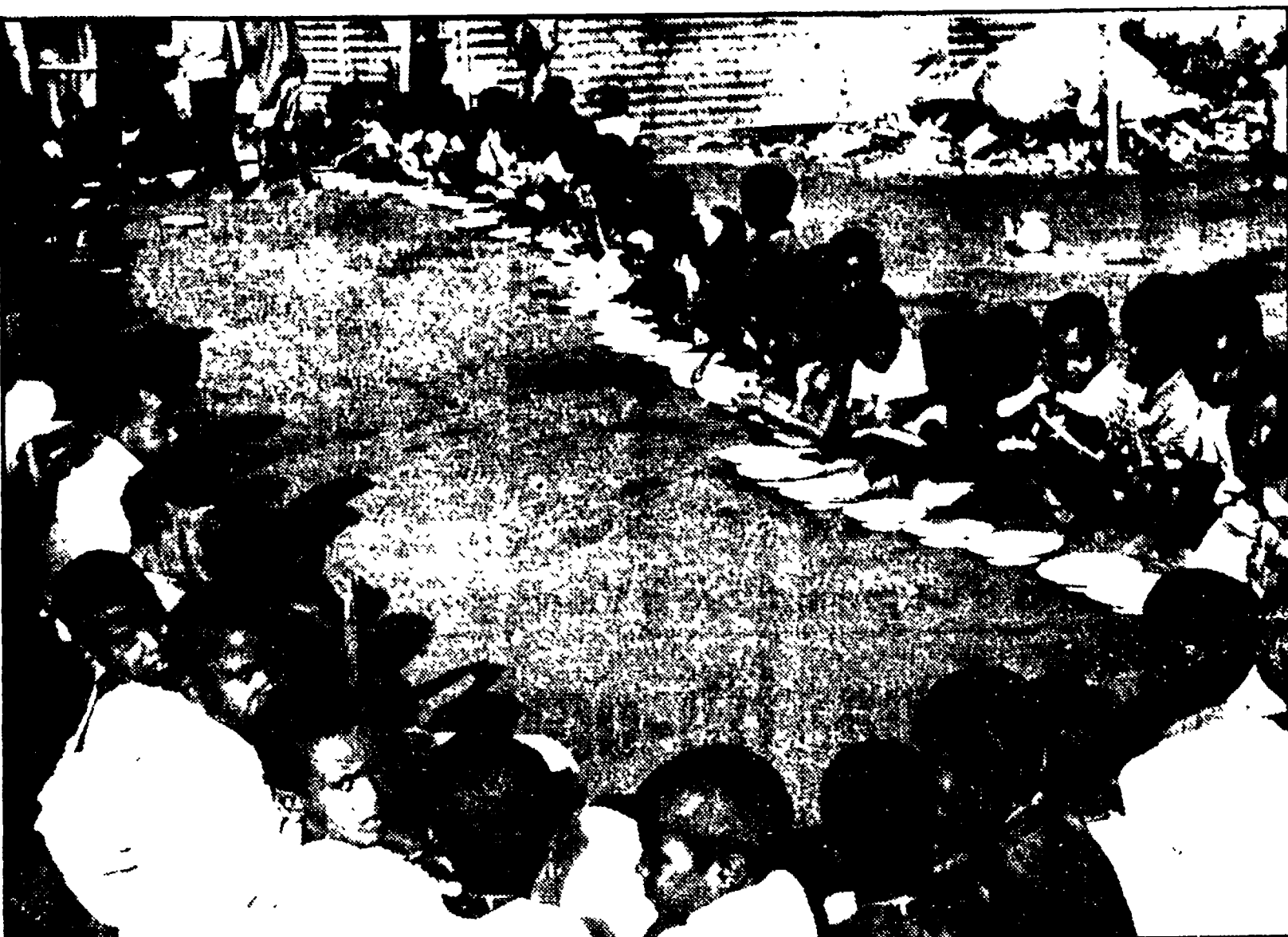
Un campo di assistenza per bambini nel Bangladesh colpito da ricorrenti carestie