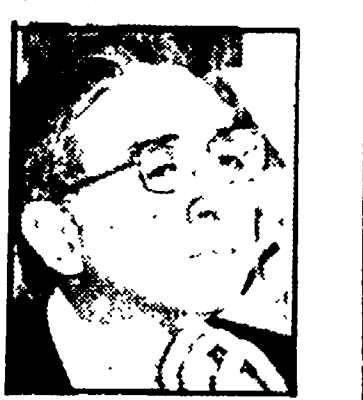
COSSIGA - Possibile interim?

Dopo le polemiche « a caldo » dei risultati, è giunto ora il momento di guardare alle questioni da affrontare in un quadro, appunto, in cui i vecchi sistemi di alleanze appaiono privi di base politica. Questione del governo, questione — in termini più immediati — delle presidenze di Montecitorio, del Senato e di tutti gli uffici parlamentari.