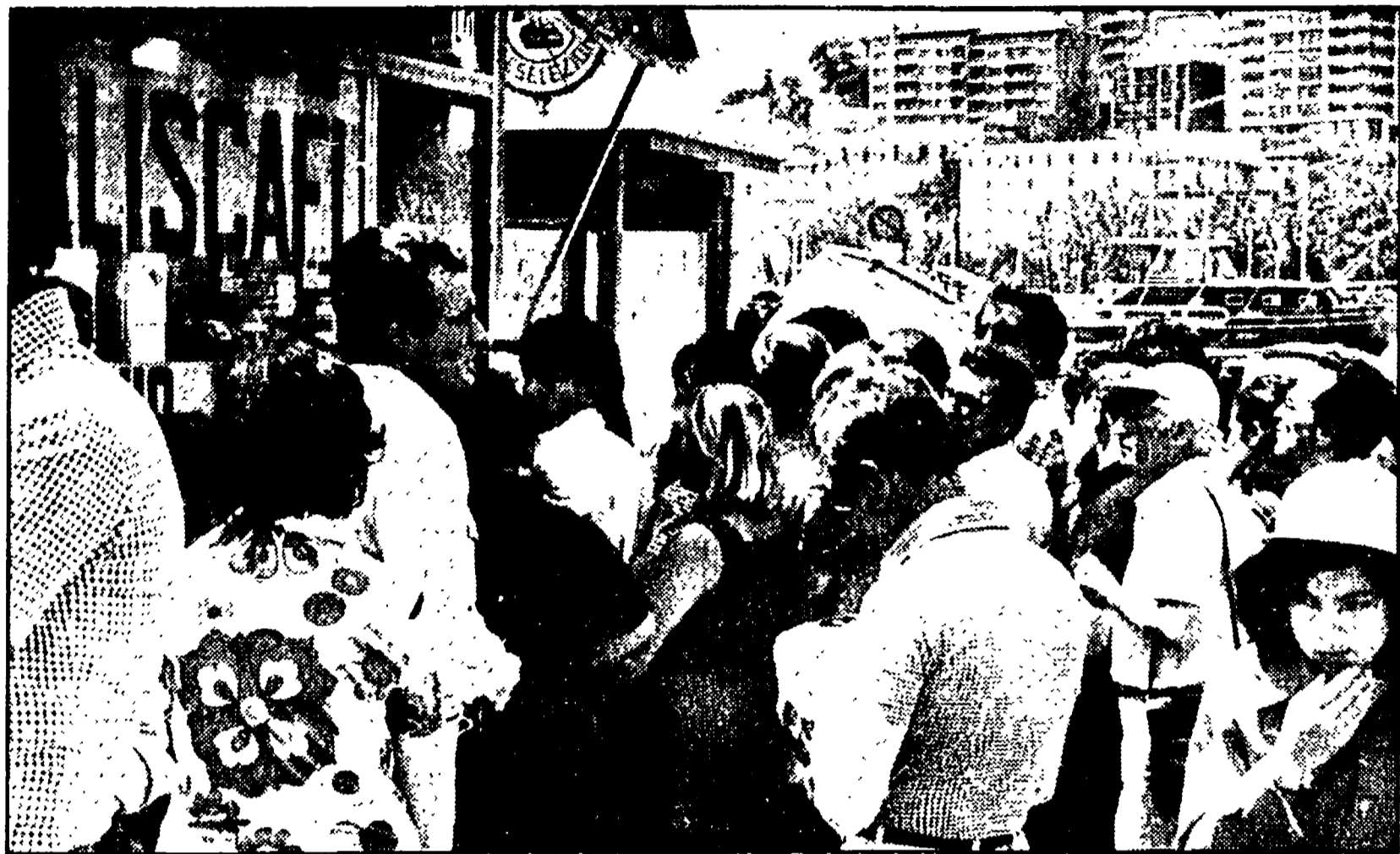
Disagio ieri per i viaggiatori che pensavano di recarsi nelle località balneari con gli aliscafi, i quali in gran parte non hanno lasciato gli ormeggi per lo sciopero del personale.

Hanno funzionato invece i mezzi dell'Alilauro — Necessario che il padronato si decida a trattare per evitare disagi agli utenti — Stamane il servizio dovrebbe riprendere in modo regolare