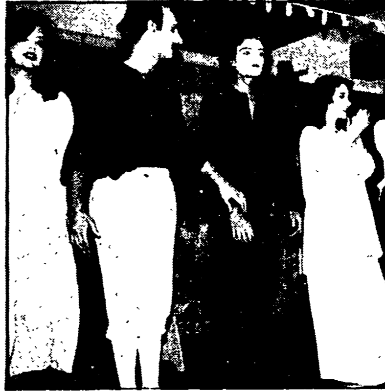
Fermignano. La compagnia «Teatro dell'Elfo» nel suo ultimo spettacolo: «1789»

FANO, 9. Nel quadro dell'attività della Compagnia dell'Elfo, che è stata organizzata alla Corte Malatestiana di Fano e a «prova aperte» dello spettacolo teatrale «Il Mandato» di Erdman, si è tenuto un incontro con i dirigenti del teatro e con il pubblico.