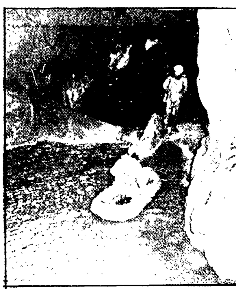
Giovani del CAI perugino al lavoro in una grotta sotterranea

E' la più grande d'Italia che si conosca - Il sottosuolo fornirà moltissime indicazioni per la corretta gestione del patrimonio idrico delle montagne umbre. Sono state fatte numerose ricerche speleologiche - Il sostegno della Regione