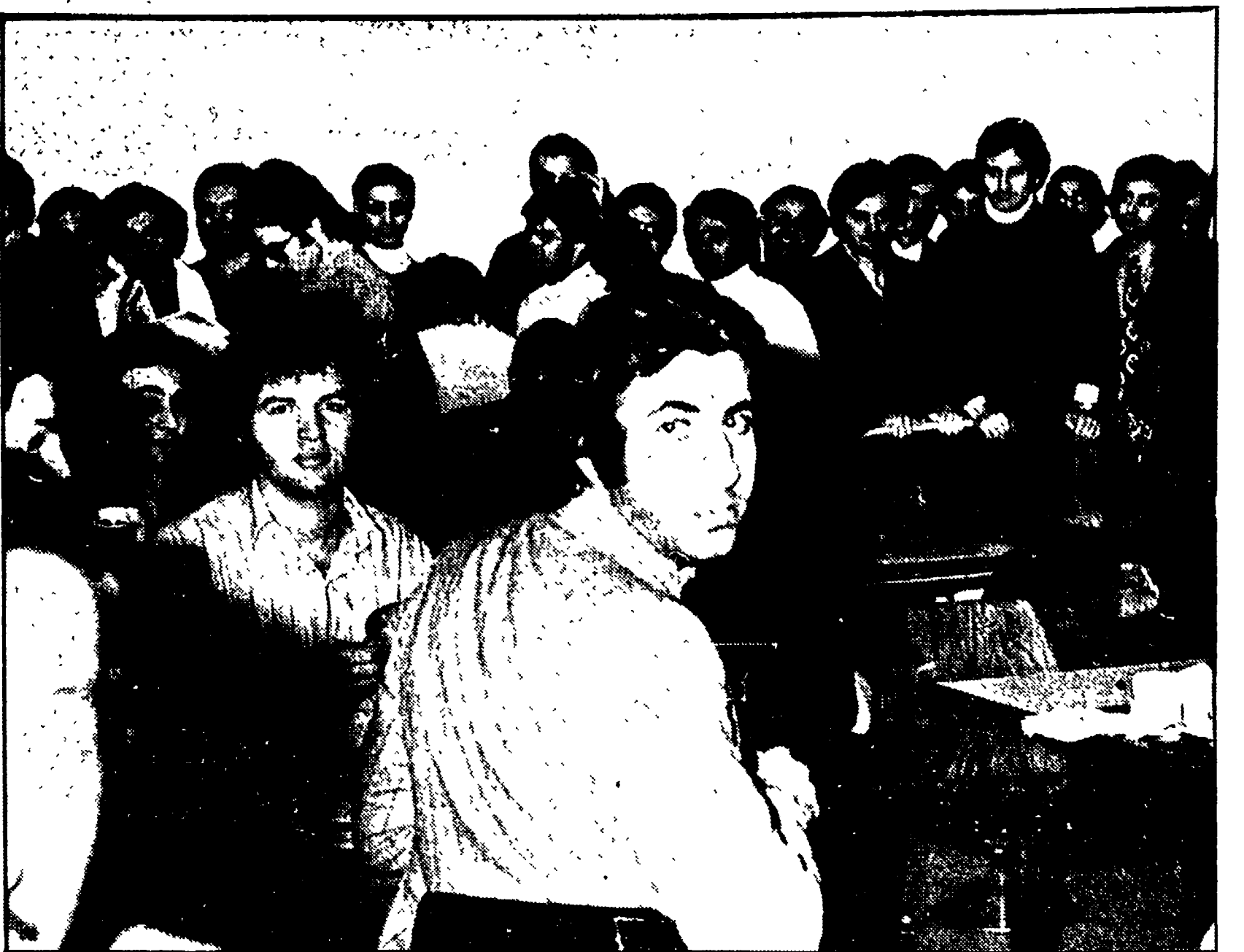
Un gruppo di studenti stranieri dell'Università senese

Compie 60 anni la prestigiosa iniziativa culturale