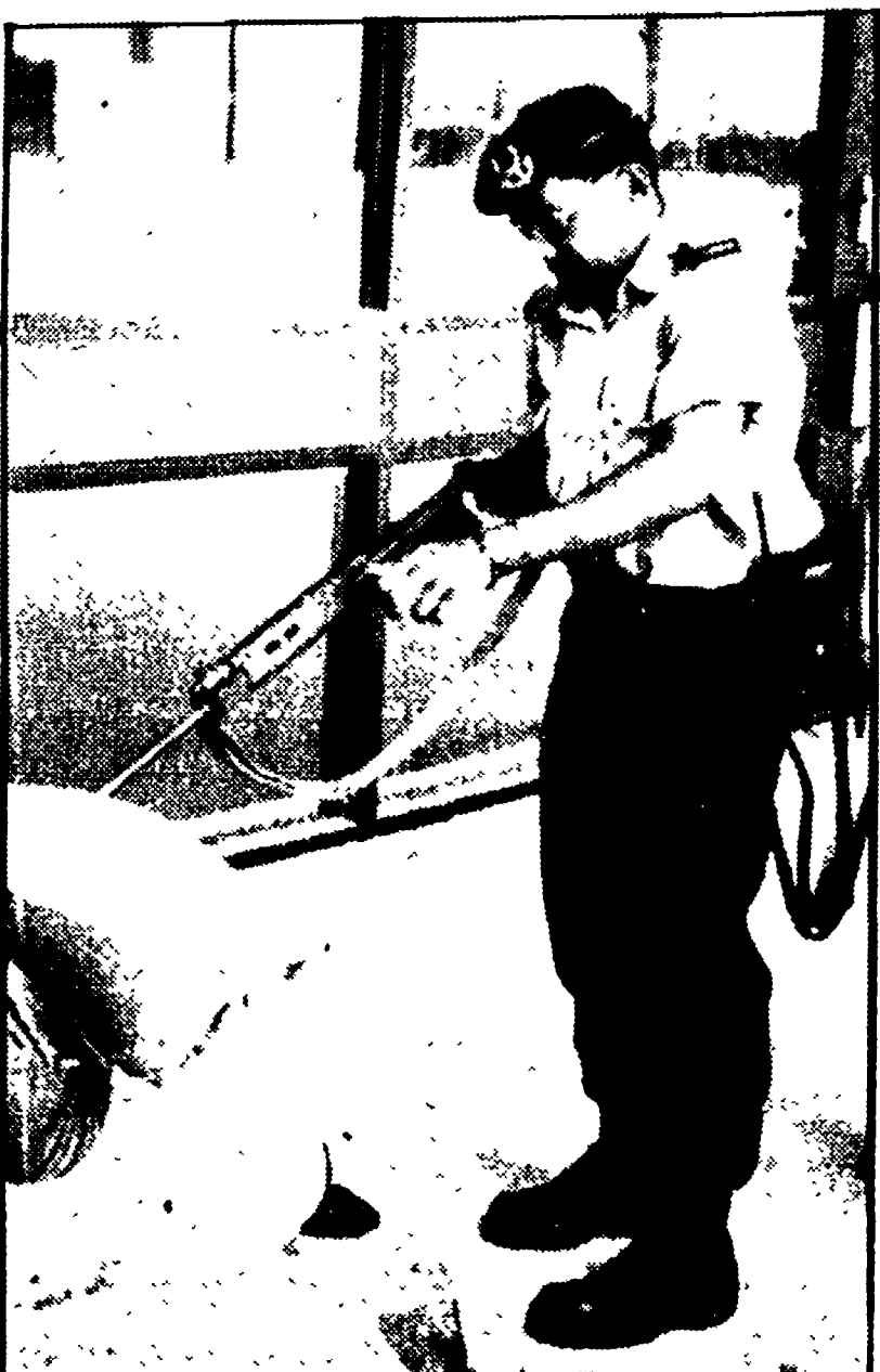
MONTREAL — Un soldato del servizio speciale canadese di stanza fissa presso l'alloggio degli israeliani «sonda» con la canna del fucile i sacchi di sabbia ammucchiati «per ogni evenienza». Nel sistema di sicurezza non c'è posto per la fiducia.