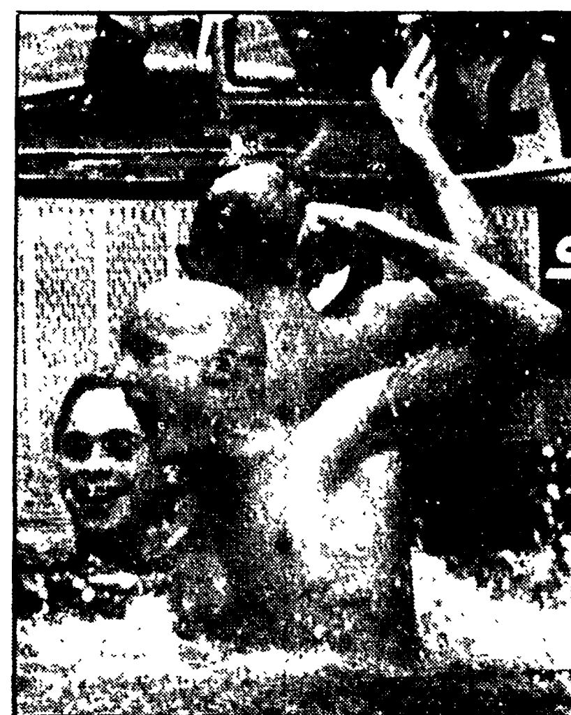
● L'esultanza del pelatissimo statunitense MIKE BRUNNER vincitore, con tanto di record del mondo, del 200 farfalla. A destra l'americano NABER che ha vinto i 100 dorso battendo anch'egli il primato del mondo

MONTREAL, 19. Le ultime gare della giornata odierna vedevano la assegnazione di quattro titoli nel nuoto e una nella ginnastica a squadre. Grosso risultato nei 100 s.l. femminile, dove la tedesca della RDT, Kornelia Ender oltre ad essersi aggiudicata la medaglia d'oro ha stabilito il nuovo record del mondo con il tempo di 55"55, battendo il precedente già da lei detenuto con 55"77. La medaglia d'argento è andata alla sua connazionale Priemer, il bronzo all'olandese Brigitha. Un altro primato del mondo è stato ottenuto dall'americano Hencken, nella seconda batteria di semifinale dei 100 m. rana con il tempo di 1'02"52. La finale che si disputerà domani vedrà in gara anche l'azzurro Giorgio Lalle che ha stabilito il tempo di 1'14"35 (quinto miglior tempo), che è anche nuovo record italiano. Altro prestigioso record del mondo è stato stabilito dall'americano Naber nei 100 dorso, con il tempo di 55"49 (precedente 56"19), argento all'altro americano Rocca di origine italiana, bronzo al tedesco della RDT Roland Matthes.