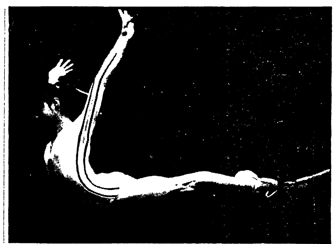
MONTREAL — NADIA COMANECI alle parallele asimmetriche: uno spettacolo di grazia e abilità

MONTREAL, 19. Nadia Comaneci si è presentata a Montreal, Sulla galea pedana del Forum la quindicenne ginnasta romena ha addirittura raggiunto un punteggio storico: un dieci, che mai prima d'ora in un Olimpiade era stato assegnato. E si trattava soltanto dell'inizio agli obbligati.