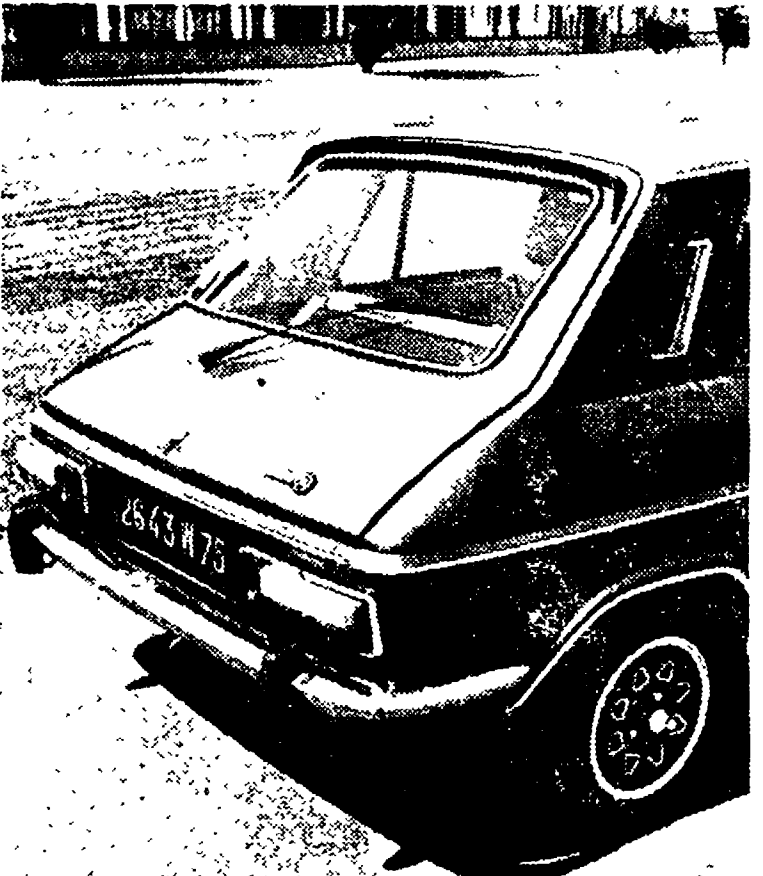
Vista posteriore del modello 1977 della Simca 1100 TI, che adesso è venduta con il tergicristallo del lunotto montato di serie.

Sempre dal punto di vista meccanico, la Chrysler Simca 1609 e la Chrysler Simca 2 Litri Automatiche sono dotate di due miglioramenti importanti: l'accensione transistorizzata e il doppio circuito di frenata anteriore e posteriore, con indicatore di caduta di pressione sul cruscotto.