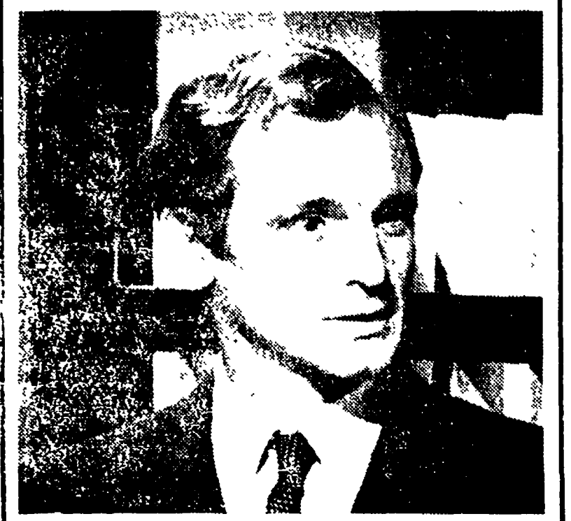
Philippe Leroy, interprete del film «Il buco» di Becker.