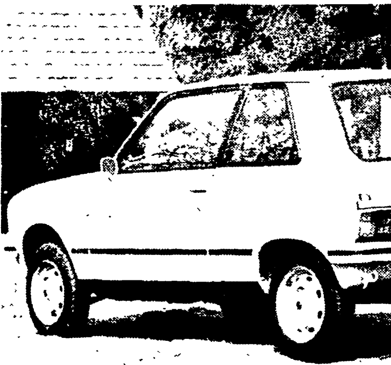
La Citroën si appresta a lanciare sul mercato una nuova vettura che potrebbe essere destinata a soppiantare le famosissime Dyane e Ami 8. Anche la "LN", della quale una agenzia di stampa ha diffuso la foto che riproduciamo, sarebbe equipaggiata con un motore a due cilindri di 602 cc. La velocità massima della vettura è tra i 120 chilometri orari. Le vendite in Francia dovrebbero cominciare a fine anno.

In sei mesi raddoppiati i costi di esercizio