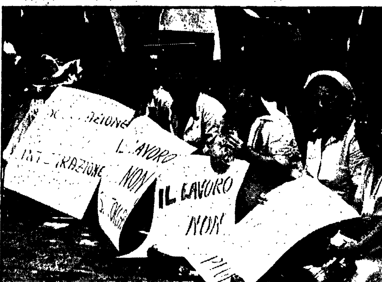
Una manifestazione dei lavoratori del gruppo Andreae (oggi tutta la Calabria - come riferimento in altra parte del giornale - si è fermata 4 ore a sostegno della loro lotta)...

Devono rappresentare un taglio con il sistema assistenziale - Tra gli altri, afferma il sindacato, debbono essere privilegiati quelli per lo sviluppo agro-industriale - E' indispensabile che questi progetti siano inquadri in una organica programmazione regionale