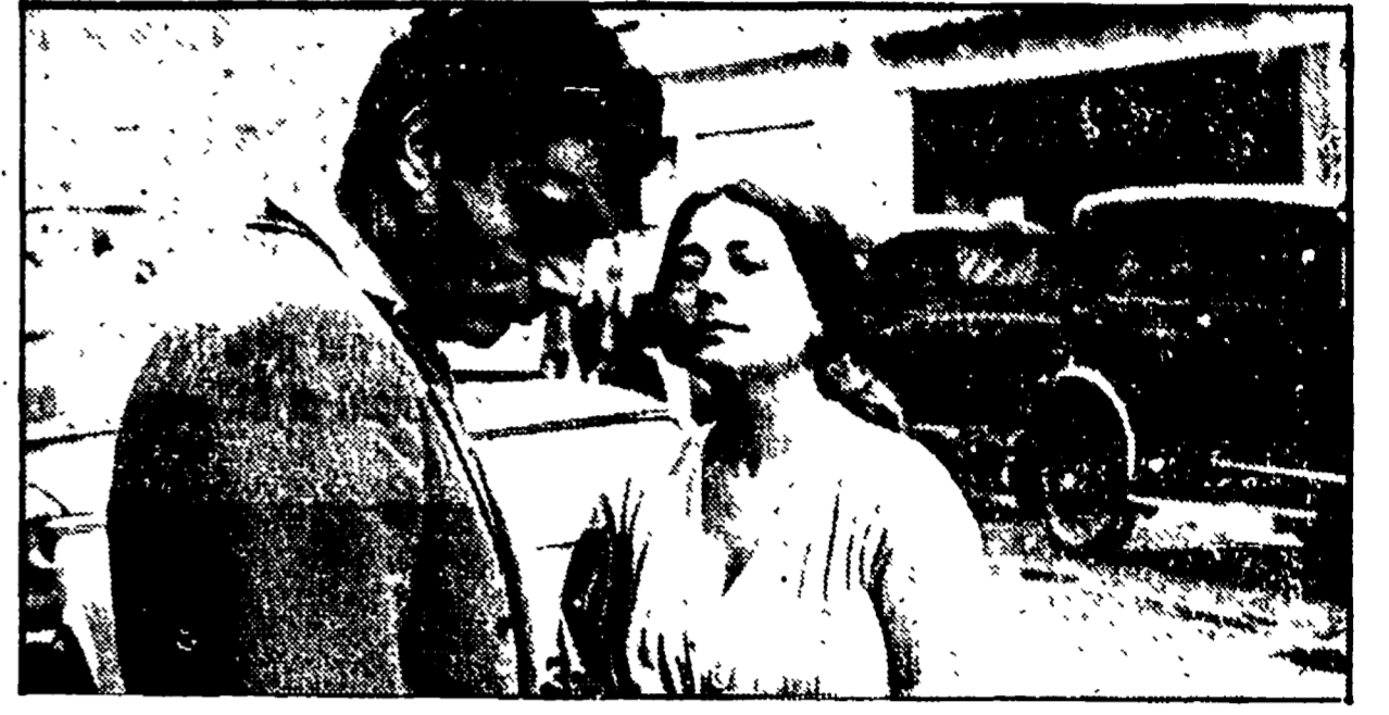
Gian Maria Volonté e Annie Girardot in un'inquadratura del film «Il sospetto»

Mentre le sale commerciali offrono uno sconsolante panorama, intenso è lo sforzo dell'associazionismo, del CTAC e degli Enti locali