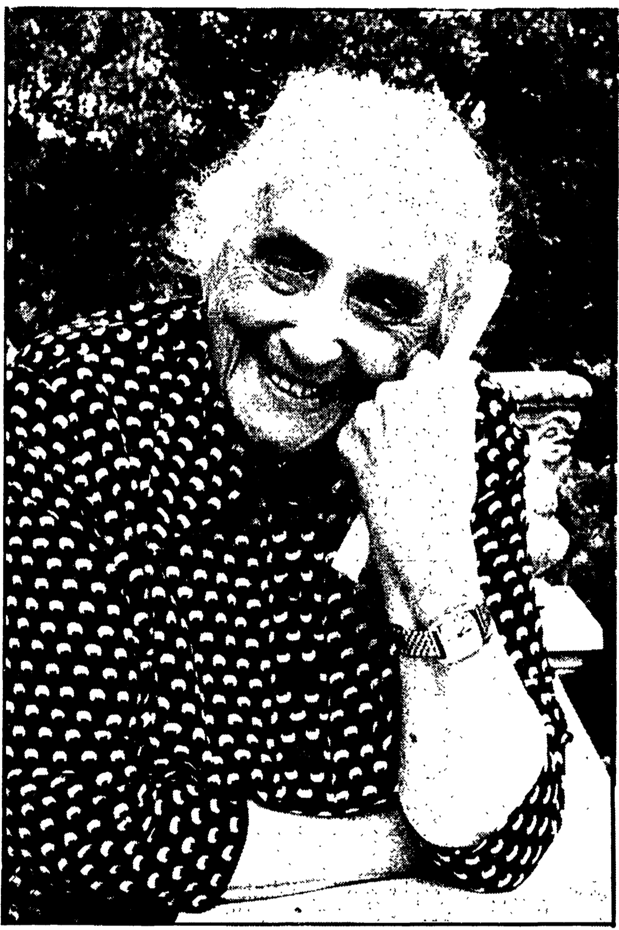
La compagna Dolores Ibarri nel corso dell'intervista rilasciata al nostro giornale.