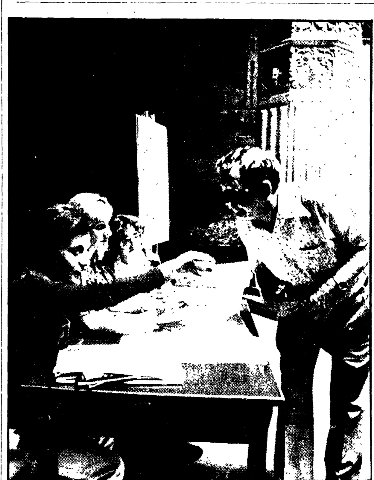
I giovani borsisti «al lavoro»