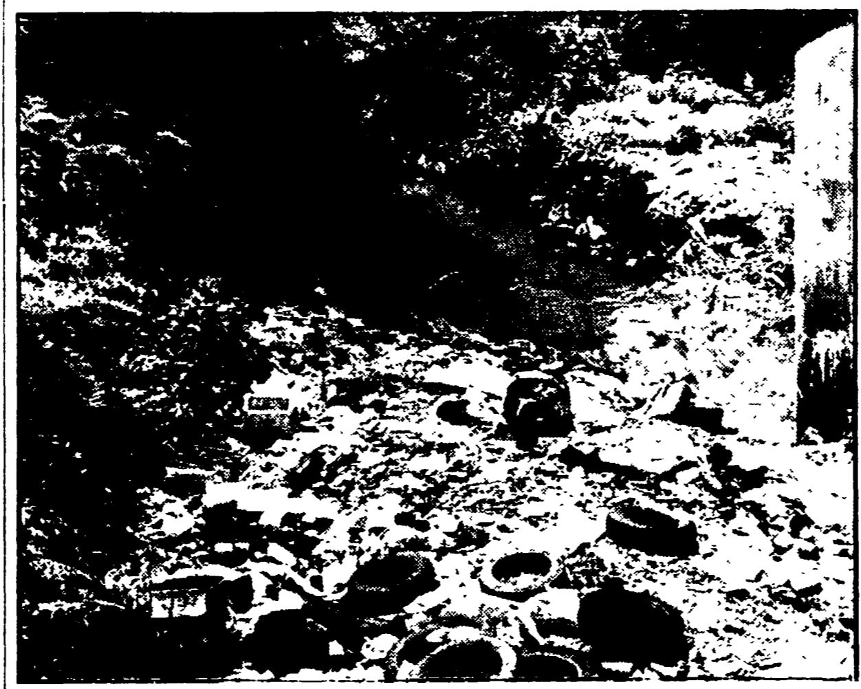
Un tratto inquinato del torrente Vingone

Proposto il rinvio della scadenza del 13 agosto prevista dalla legge governativa per le autorizzazioni sull'inquinamento