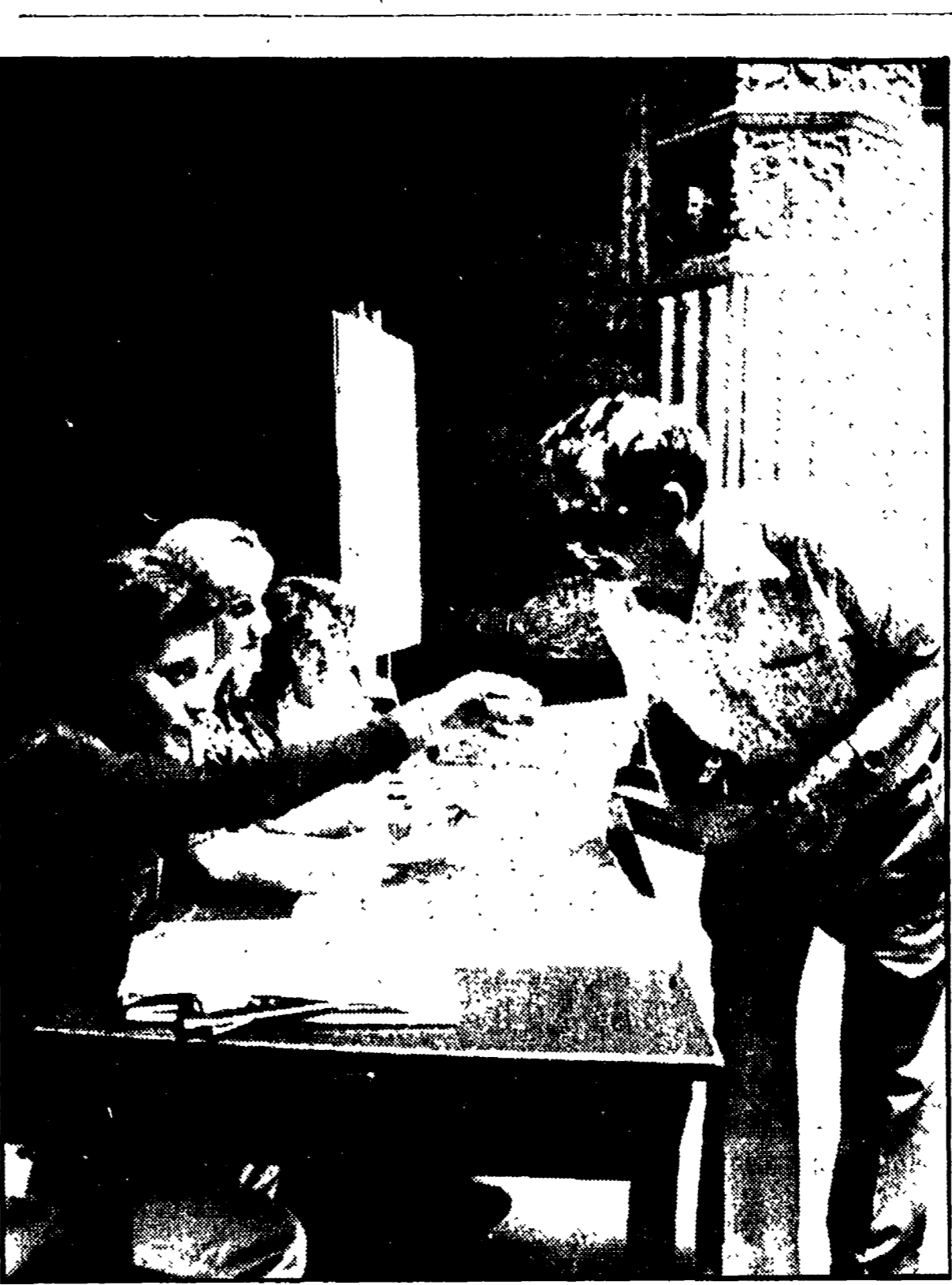
I giovani borsisti « al lavoro »