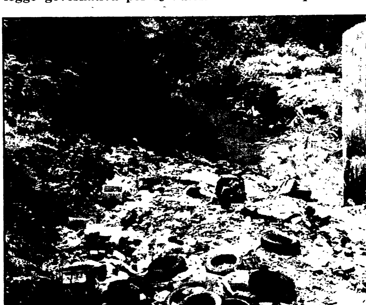
Un tratto inquinato del torrente Vingone

Proposto il rinvio della scadenza del 13 agosto prevista dalla legge governativa per le autorizzazioni sull'inquinamento