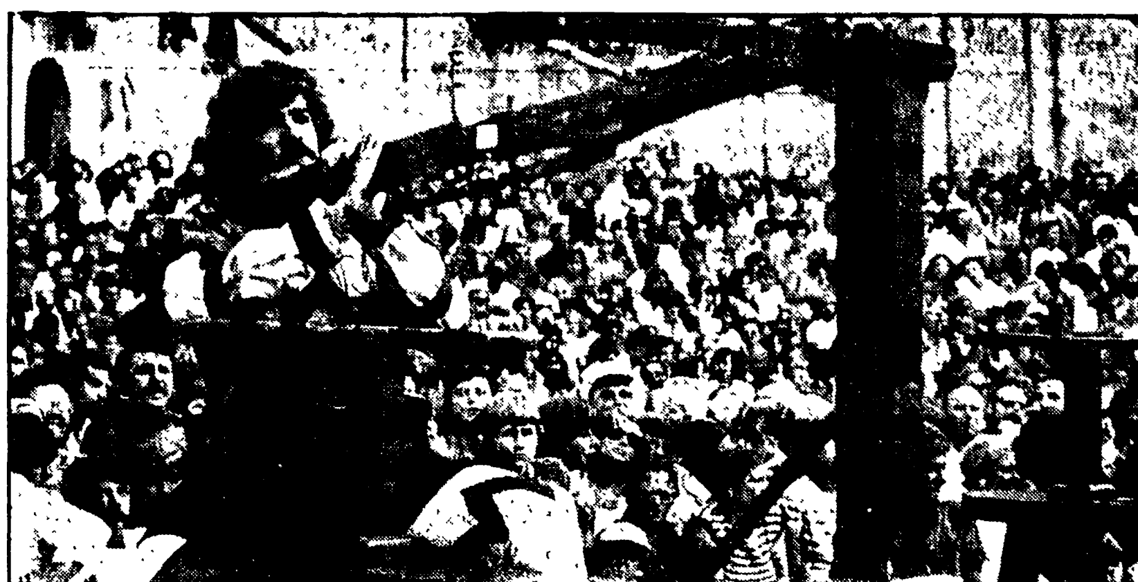
È il momento di concentrazione in cui viene presa la mira: a 36 metri il « Girifalco »

La grande struttura cooperativa a gestione pubblica è al centro di una vertenza delle sue maestranze che da tre giorni occupano gli stabilimenti di Albina e Tarquinia per un mese di tempo di lavoro. Il tratto di una questione spinosa cui occorre dare una soluzione positiva secondo gli obiettivi chiesti dal complesso movimento democratico quali la piena, razionale ed economica utilizzazione degli impianti, il rispetto per l'ambiente, il rapporto tra il CONALMA, le cooperative di produttori e gli enti locali per delineare la promozione di conferenze di produzione, la programmazione e gli orientamenti culturali nel settore.