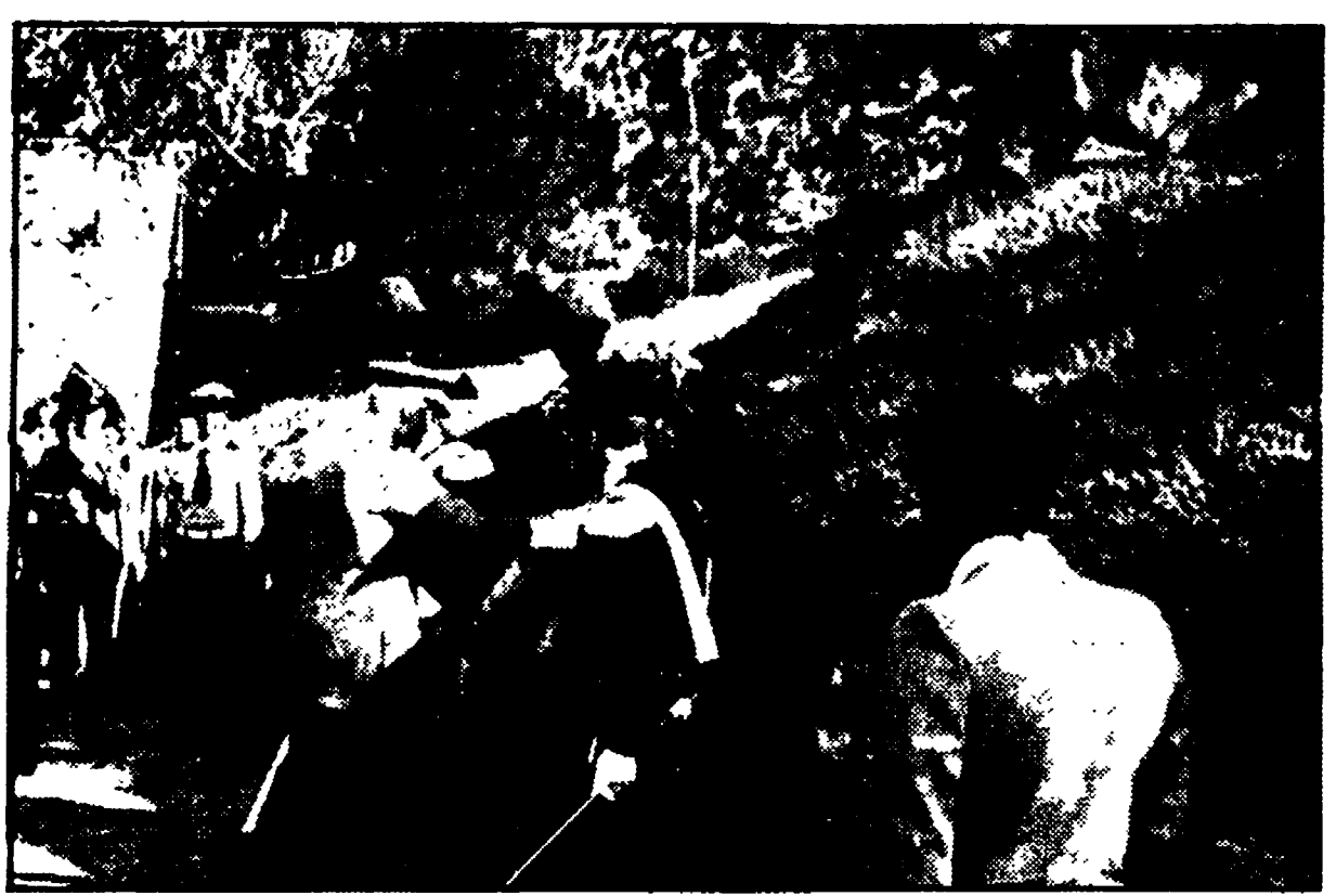
Un momento della cerimonia commemorativa

Erano presenti il vicesindaco, rappresentanti delle diverse armi, di associazioni civili e militari - Deposta una corona ai piedi del monumento sul colle San Francesco