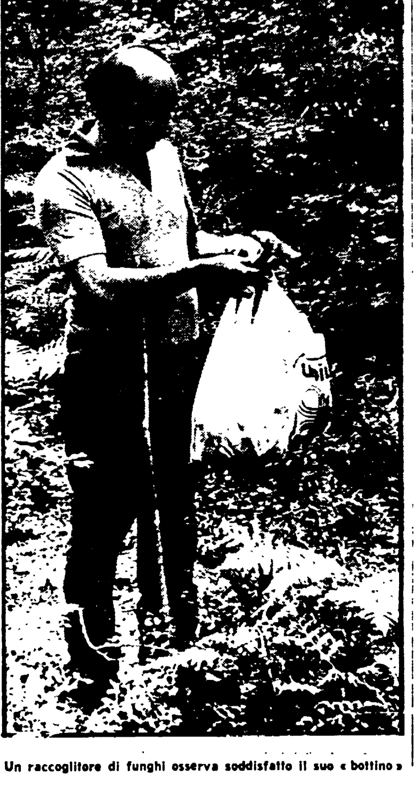
Un raccoglitore di funghi osserva soddisfatto il suo «bottino»