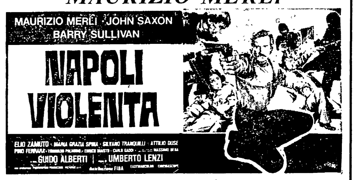
Vietaio ai minori di 14 anni - Orario spettacoli: 17 - 18,45 - 20,30 - 22,30 SOSPENSE TUTTE LE TESSERE E LE ENTRATE DI FAVORE

ANCORA UNA VOLTA IL PUBBLICO APPLAUDE A SCENA APERTA LE GESTA DEL COMMISSARIO BETTI, INTERPRETATO DA MAURIZIO MERLI