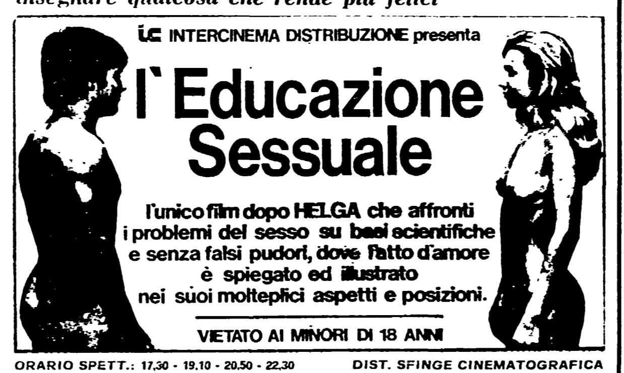
ORARIO SPETT.: 17,30 - 19,10 - 20,50 - 22,30 DIST. SFINGE CINEMATOGRAFICA

Questo film dimostra che non è immorale far vedere un uomo e una donna che si amano - In tutte le possibili variazioni e posizioni - Quando ciò può servire ad insegnare qualcosa che rende più felici