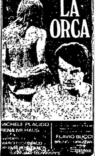
Vietaio ai min. di anni 18 Spett. 17 - 18,50 - 20,40 - 22,30

Se qualcosa vi disturba ne «LA ORCA» non abbassate gli occhi