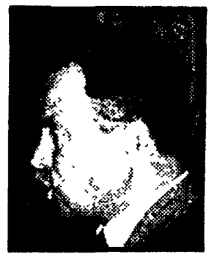
COMPAGNONI - Per una democratica programmazione