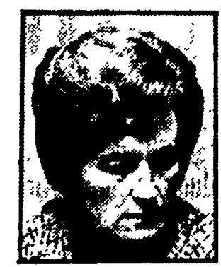
ANSELMI - Un avvicendamento all'industria