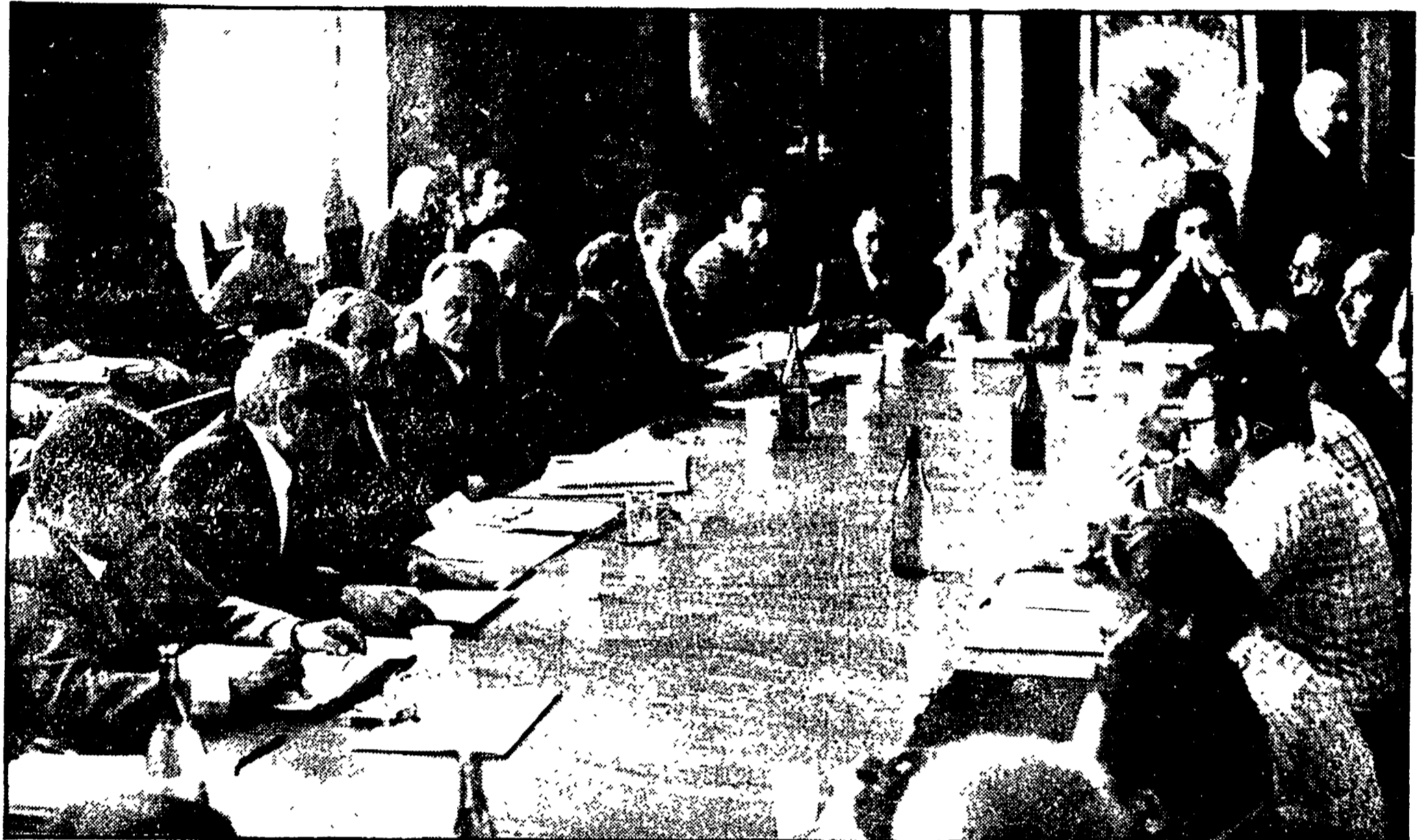
Un aspetto della riunione svoltasi ieri nella sede dell'amministrazione provinciale

Messo a fuoco il quadro della drammatica situazione - Avanzata la richiesta di un piano di intervento per far fronte all'emergenza e alla prospettiva - Necessario sbloccare i fondi della legge regionale per l'istruzione