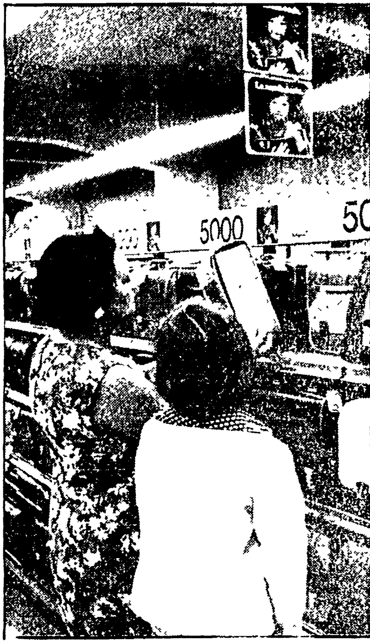
Le spese per il «corredo» scolastico incidono pesantemente sui bilanci familiari, già colpiti dall'inflazione galoppante

Nuove sorprese in cartoleria. Il 20% in più rispetto allo scorso anno sui prodotti che compongono il corredo degli scolari e degli studenti - I riflessi negativi sui bilanci delle famiglie. Fervono i preparativi per l'allestimento delle vetrine. Per il momento le vendite vanno a rilento