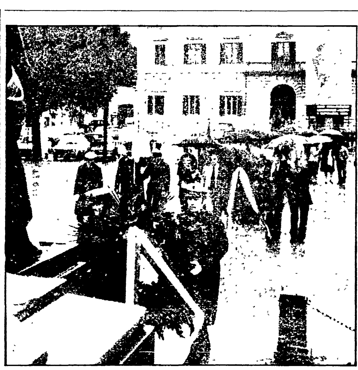
Un momento della cerimonia commemorativa

Un giovane gli ha chiesto l'ora, poi lo ha stordito con una gragnuola di colpi al viso - Gli agenti testimoni della rapina lo hanno invano inseguito